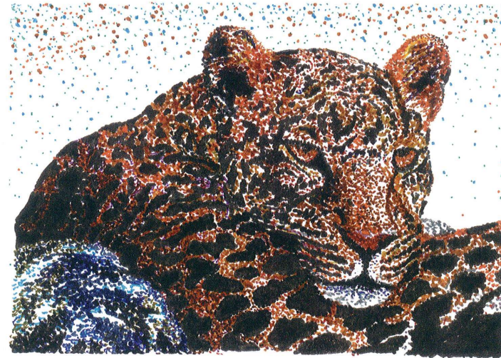
Obra elaborada con rotuladores de colores de punta fina