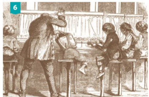
Castigos que exercían os capataces contra os nenos na fábrica, 1856.

Testemuño extraído dunha enquisa en Gran Bretaña, 1834.