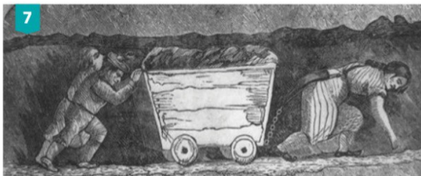
Nenos ingleses nunha mina de carbón. Gravado do século XIX.

8 A admisión dos nenos nas fábricas dende a idade de 8 anos é para os pais un medio de supervivencia, para os nenos, un inicio na aprendizaxe, para a familia, un recurso necesario. O hábito da orde, da disciplina e do traballo debe ser adquirido canto antes mellor.