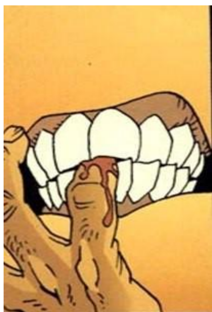
Primerísimo primer plano:

Es la viñeta descriptiva por excelencia. Se utiliza para dar a conocer algún detalle que se ha pasado por el alto en las viñetas anteriores