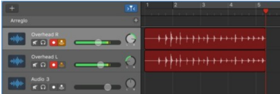
Pantalla grabación podcast en