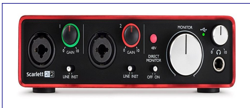
Focusrite Scarlett 2i2

O primeiro que tes que facer si non o fixeche xa, é conectar a tua interfaz de grabación o teu ordenador por medio de la conexión USB . Despois conecta o teu micro á interfaz .