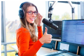
Grabando podcasts.

Un consello básico é que intentas falar o máis perto do micrófono, sin chegar a tocalo e modular a voz a tal efecto. Además de intentar manter sempre a mesma distancia o micro.