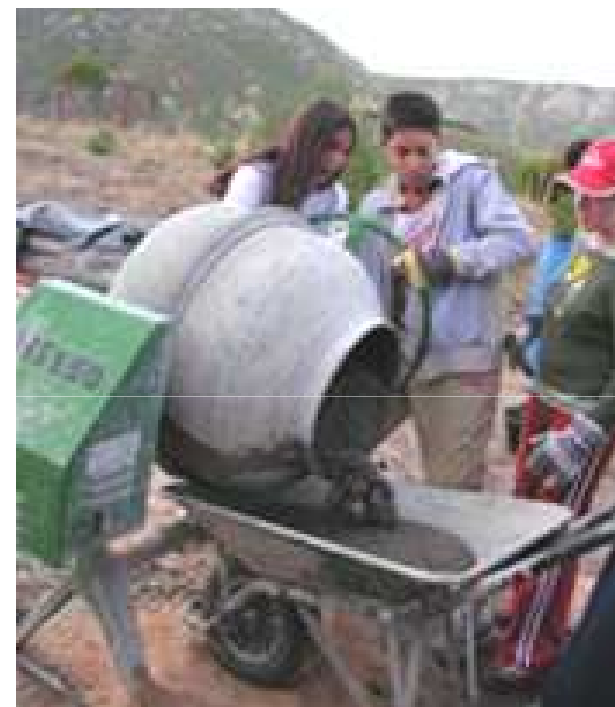
Coordinadora Infantil y juvenil de Tiempo Libre de Vallecas