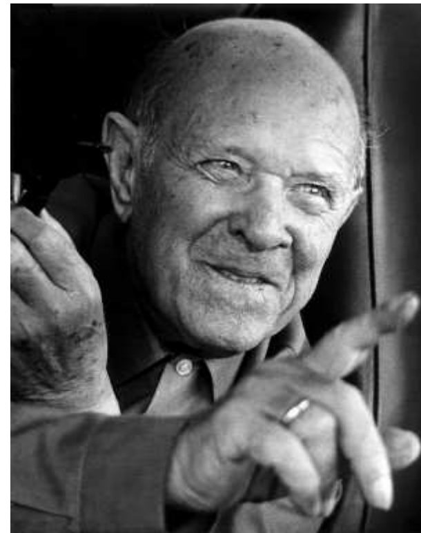
CEIP Pau Vila con la Fundación Pau Casals

Conocimientos y habilidades musicales, conocimientos sobre la biografía y los valores humanos de Pau Casals, capacidad de comunicación.