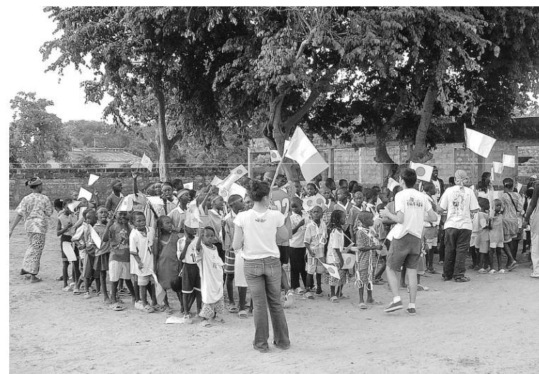
Colegio de Salesianos de Mataró

Conocimientos sobre Senegal; habilidades organizativas y comunicativas con la población adulta, responsabilidad y compromiso.