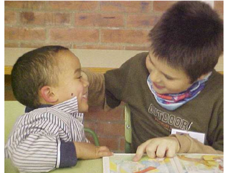
CEIP La Monjoia

Mejora de la lectura, la gestualidad y la expresión oral; así como la relación con niños y niñas más pequeños, ejercitando la paciencia y la responsabilidad.