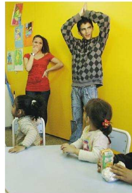
IES Eduard Fontseré con el Esplai La Florida