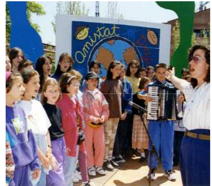
CEIP Milagros Consarnau

Sensibilización y conocimiento de las necesidades de los ancianos, actitudes de respeto, tolerancia y compromiso, mejora de las habilidades musicales.