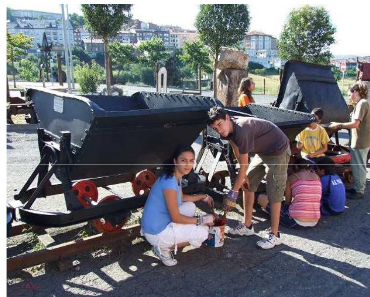
Club d'Esplai Bellvitge de L'Hospitalet de Llobregat con el Museo de la Minería del País Vasco

Conocimientos sobre historia y cultura del País Vasco y la minería; habilidades organizativas; técnicas de recuperación y conservación; habilidades sociales para relacionarse y colaborar con las personas adultas.