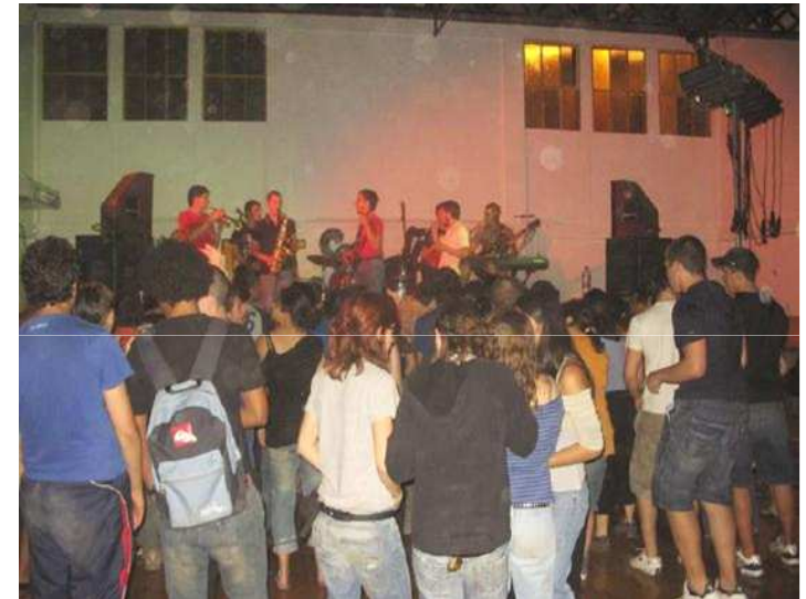
Fundación ADSIS y centros de secundaria

Habilidades organizativas y de trabajo en grupo, habilidades técnicas en el montaje de un concierto; conocimiento y sensibilización frente a un problema social, reflexión sobre las causas de las situaciones de injusticia, conocimientos geográficos concretos en relación a la población destinataria.