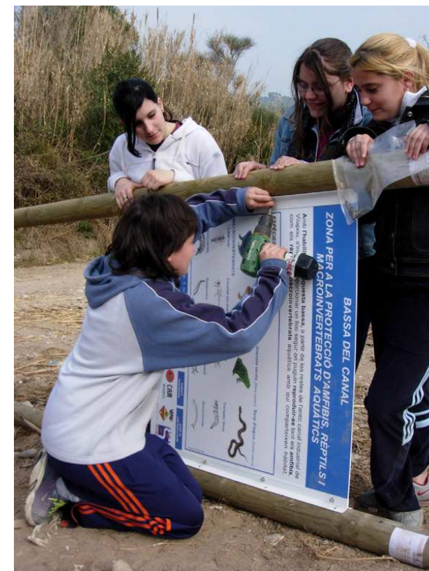
Proyecto Ríos con centros educativos

Conocimientos del ecosistema acuático, habilidades técnicas para realizar las tareas, organización y trabajo en equipo, sensibilización hacia la conservación de la naturaleza.