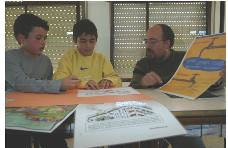
Escuelas públicas de Sant Joan despí con el centro medioambiental L'Arrel

Analizar e interpretar los consumos energéticos, profundizando conocimientos de ciencias naturales, sociales y matemáticas, hábitos y actitudes de ahorro energético.