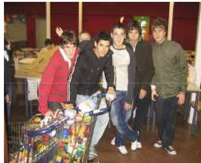
Banc dels Aliments de Barcelona con centros educativos

Conocimientos sobre nutrición, carencias y consecuencias; sobre la pobreza, las desigualdades, el despilfarro de alimentos; actitud de compromiso; capacidades organizativas y comunicativas.