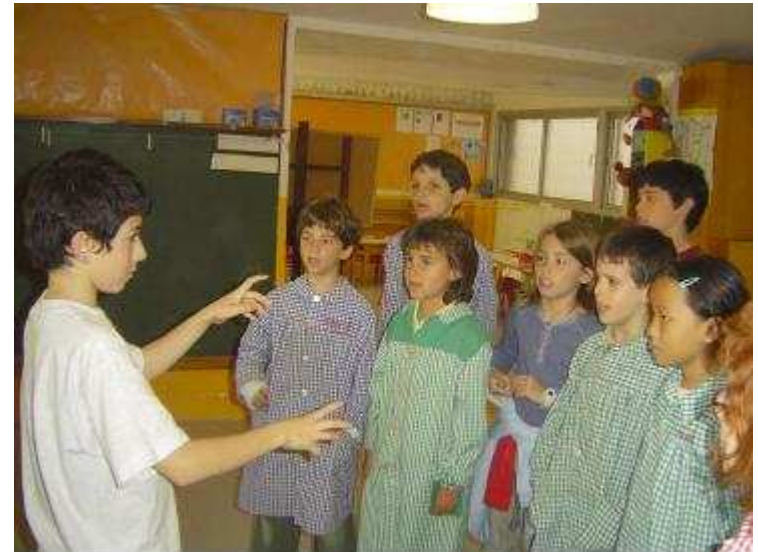
Colegio Santa Anna

Conocimientos y habilidades musicales, conocimientos culturales, organización, habilidades plásticas y comunicativas.