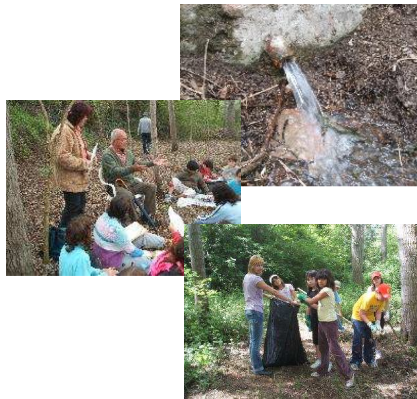
Colectivo de escuelas de la Vall de Ges

Conocimientos sobre las fuentes y su entorno natural y social, actitudes de respeto y compromiso... Todo con la ayuda de un abuelo buen conocedor de la fuente y sus propiedades y leyendas.