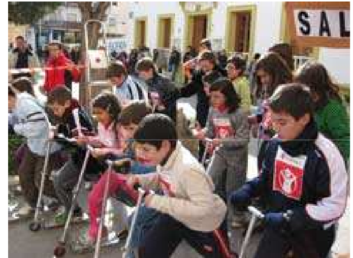
Save the Children con centros escolares

Espíritu crítico, generoso y solidario ante las injusticias y la vulneración de los derechos de los niños y niñas que no tienen acceso a la sanidad primaria ni a la educación y que están sumidos en la pobreza extrema.