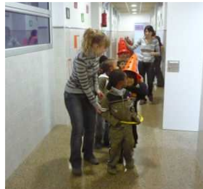
IES Eduard Fontserè y Esplai La Florida de L'Hospitalet de Llobregat

Sensibilizarse frente a una necesidad del barrio, ser capaces de tomar un compromiso, relacionarse con personas de edades diversas, poner sus habilidades y capacidades personales al servicio de los otros.