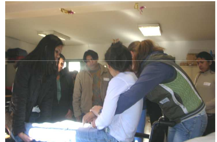
Escola Solc Nou + Càritas