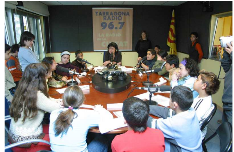
Escuelas públicas de Tarragona con la Fundación Catalana de l'Esplai

Conocimientos y habilidades en temas de salud: alimentación, higiene, actividad física, consumos, prevención de riesgos, habilidades comunicativas.