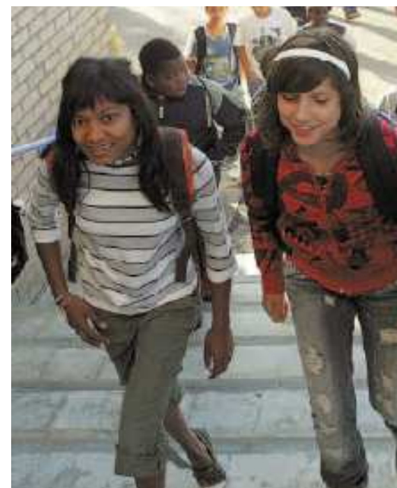
IES Rubió i Ors de L'Hospitalet de Llobregat

Conocimientos sobre los países de origen, sobre el mismo instituto y barrio, actitudes de respeto, responsabilidad y compromiso, habilidades comunicativas y sociales.