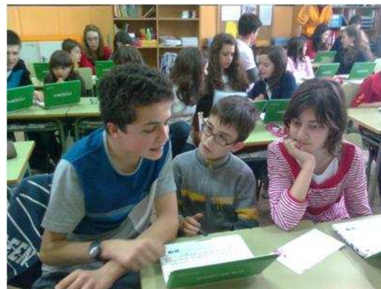
Colegio Santa María de Portugalete con Pantallas Amigas

Conocimientos sobre los riesgos de internet y cómo afrontarlos, actitudes de responsabilidad, organización, habilidades comunicativas .