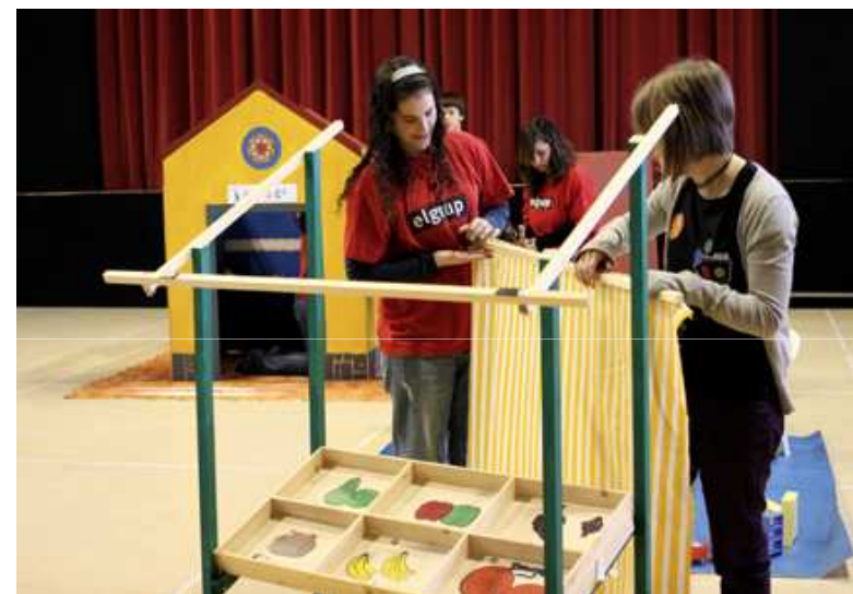
El Grup de Polinyà

Conocimientos sobre juegos, juguetes y psicología infantil, habilidades en carpintería y marquetería, trabajo en grupo, habilidades comunicativas.