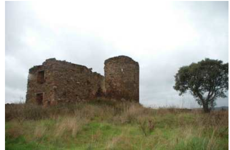
CEIP Barceló i Matas

Conocimientos naturales, culturales e históricos sobre el entorno; habilidades en el trabajo de equipo, diálogo y toma de decisiones; actitudes de respeto y compromiso.