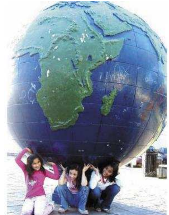
Fundación IPADE con el IES Puerta de Cuartos de Talavera de la Reina

Conocimientos sobre cambio climático y pobreza en el mundo, responsabilidad y compromiso, habilidades comunicativas y de relaciones personales.