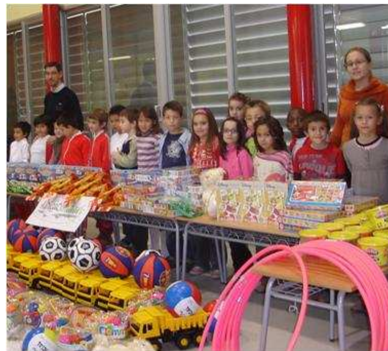
Club d'Esplai Pubilla Cases-Can Vidalet con el Hospital Sant Joan de Déu de Esplugues de Llobregat

Sensibilización frente a una problemática social, habilidades técnicas y organizativas, capacidad comunicativa, planificación y organización del trabajo.