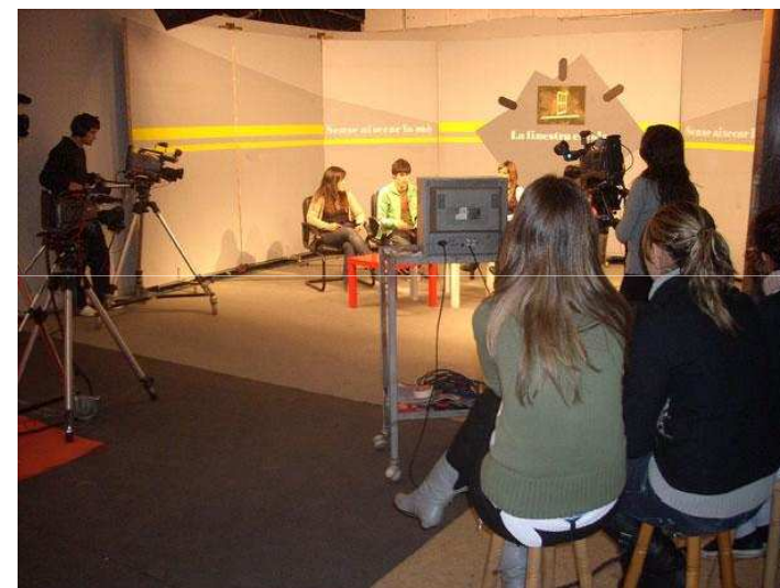
IES Miquel Biada de Mataró

Competencias periodísticas y técnicas en el campo de la comunicación; conocimientos sobre las asociaciones y sus problemáticas; habilidades sociales, sensibilidad, respeto, responsabilidad frente a los compromisos.