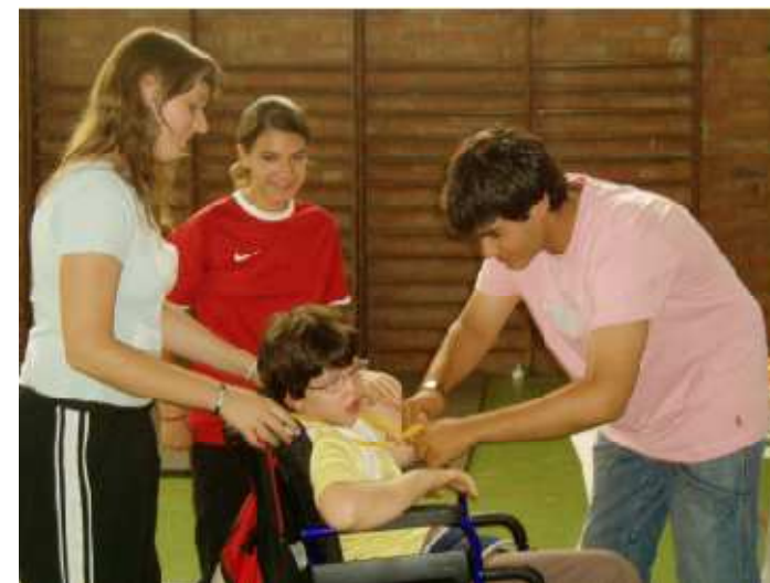
IES Bisbe Berenguer y Escola d'Educació Especial L'Escorça de L'Hospitalet de Llobregat