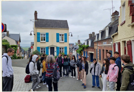
Baie de Somme