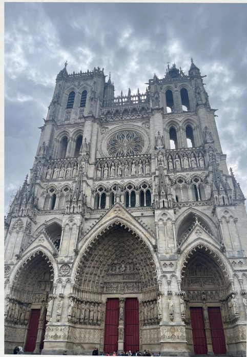
Catedral de Amiens