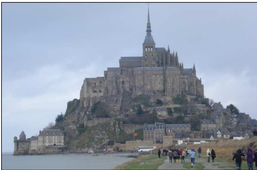
Aquí o tedes, un dos lugares máis fermosos de Francia e do mundo: o monte de Saint Michel. Cando a marea está baixa pódese cruzar a el andando sobre unha franxa de area; cando a marea está alta atópase nunha illa, rodeado de mar. Está recoñecido como Patrimonio da Humanidade pola UNESCO.

te eses días. Temos que dicir que era un lugar moi bonito e con moitas cousas para visitar. Xantamos todos xuntos nun restaurante e logo quedámonos toda a tarde na cidade. Uns decidiron ir xogar ós bolos nunha boleira que había na cidade e outros decidiron quedar nesta.