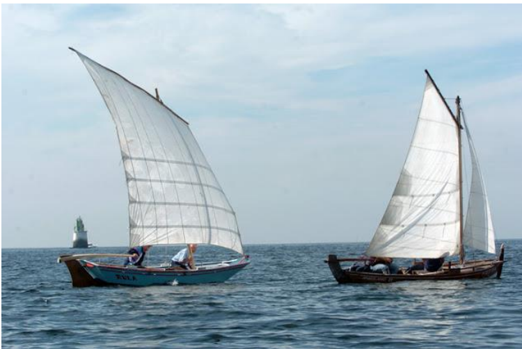
Foto dunha gamela e unha dorna