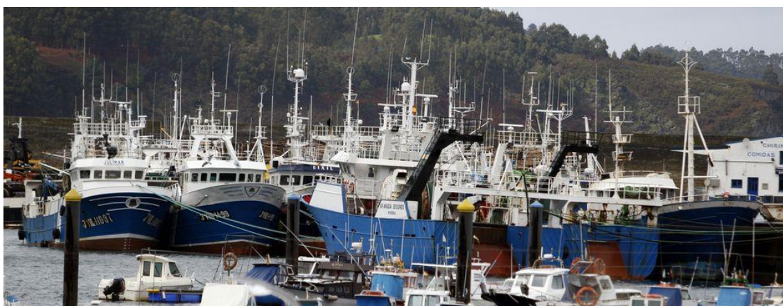
Distintos tipos de barcos