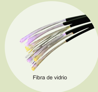
Fibra de vidrio

Existe una amplia variedad de aplicaciones para este material, lo que ha supuesto el desarrollo de un gran número de tipos diferentes de vidrio. En otras épocas, se fabricaba de un modo artesanal y resultaba muy caro, por lo que sólo aparecía en ventanas de palacios y catedrales (las vidrieras constituyen el primer tipo de vidrio que se utilizó en la construcción).