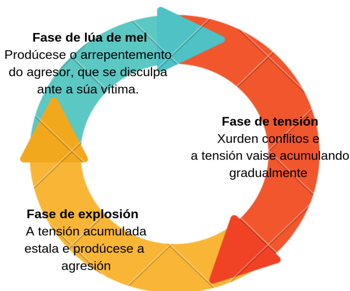
Ciclo da violencia. Elaboración propia.

Por outra banda, prácticas como o sexting contribuíron a aumentar as cifras de acoso ou violación dos dereitos sexuais nas últimas décadas. O anonimato das redes anima a insultar e ameazar en termos que poden acabar por constituír un delito de violencia de xénero.