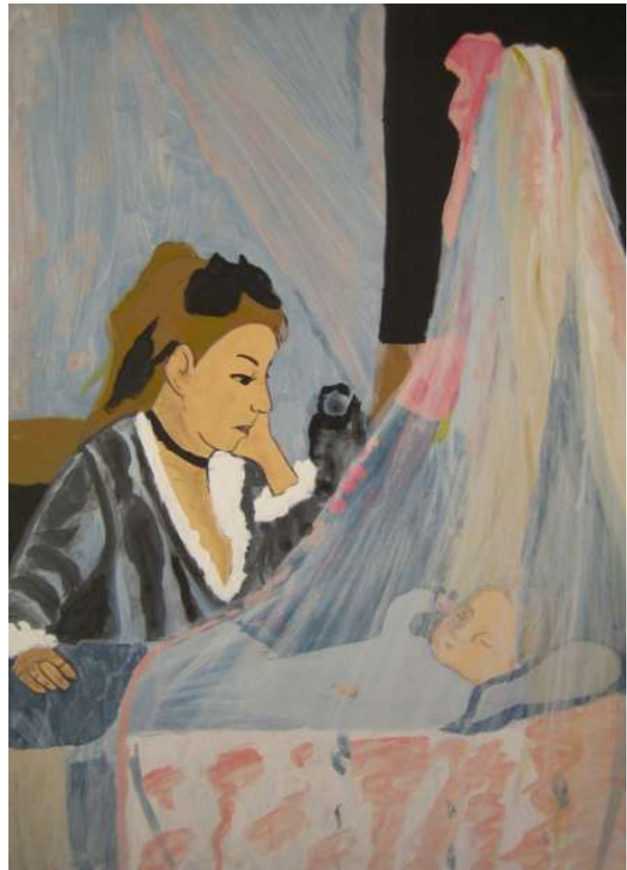
La cuna. Berthe Morisot Autor: Daniel Ruiz (4ºESO)