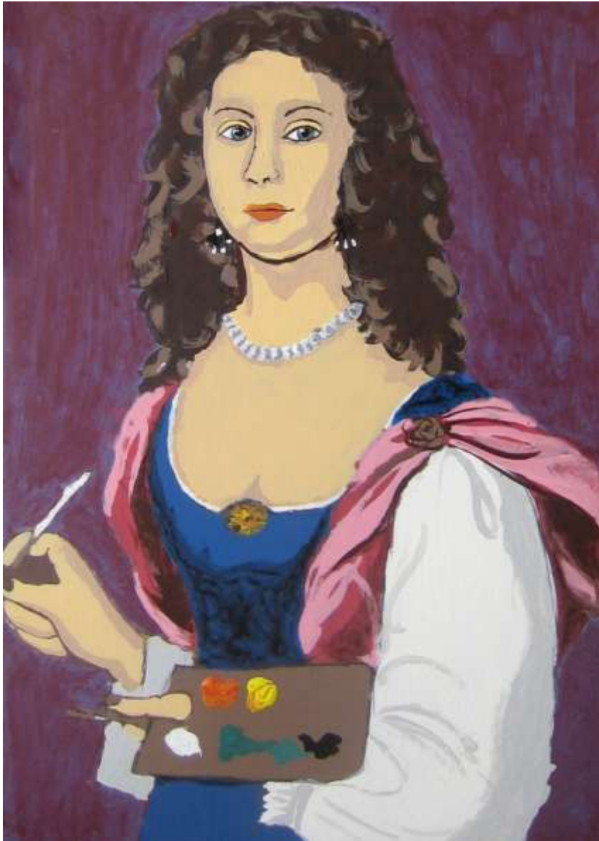
Autoretrato. Elisabetta Sirani

Por su condición de mujer, Elisabetta no pudo acceder a una academia y tuvo de aprender únicamente en el taller paterno. No se le permitió dibujar desnudos de modelos vivos. Con 19 años, se hizo pintora profesional. Cuando su padre quedó inválido, ella tuvo que mantener a su familia con su arte, y se cree que la necesidad económica le forzó a trabajar con singular rapidez.