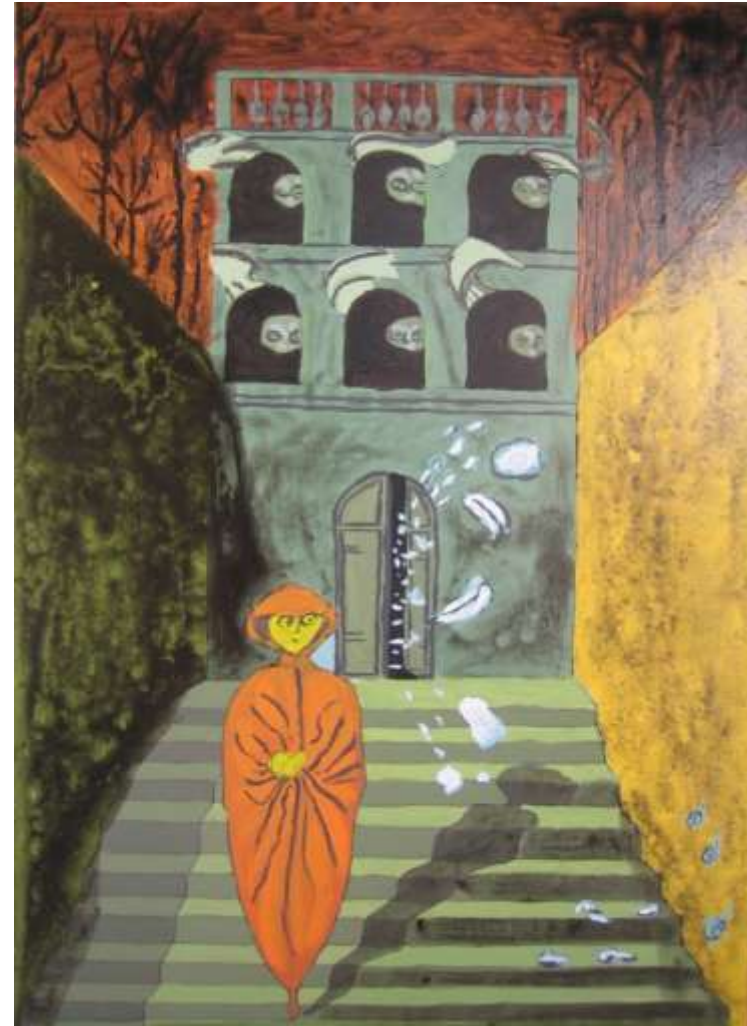
La ruptura. Remedios Varo Autores: Víctor Benítez y Raúl García (4ºESO)