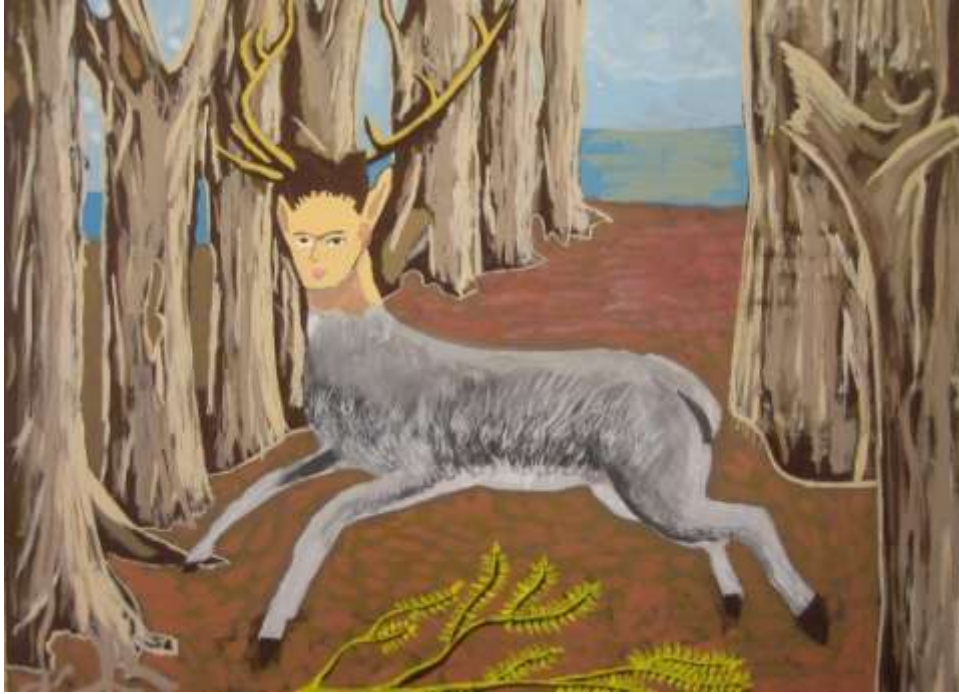
Venadito. Frida Kahlo