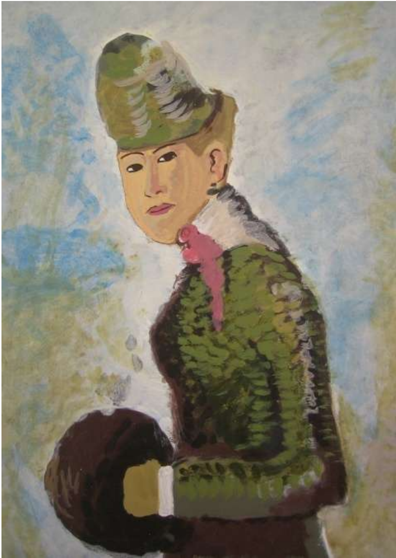
imagen. Berthe Morisot Autores: Pedro Dengra y Pedro Sierra (4ºESO)