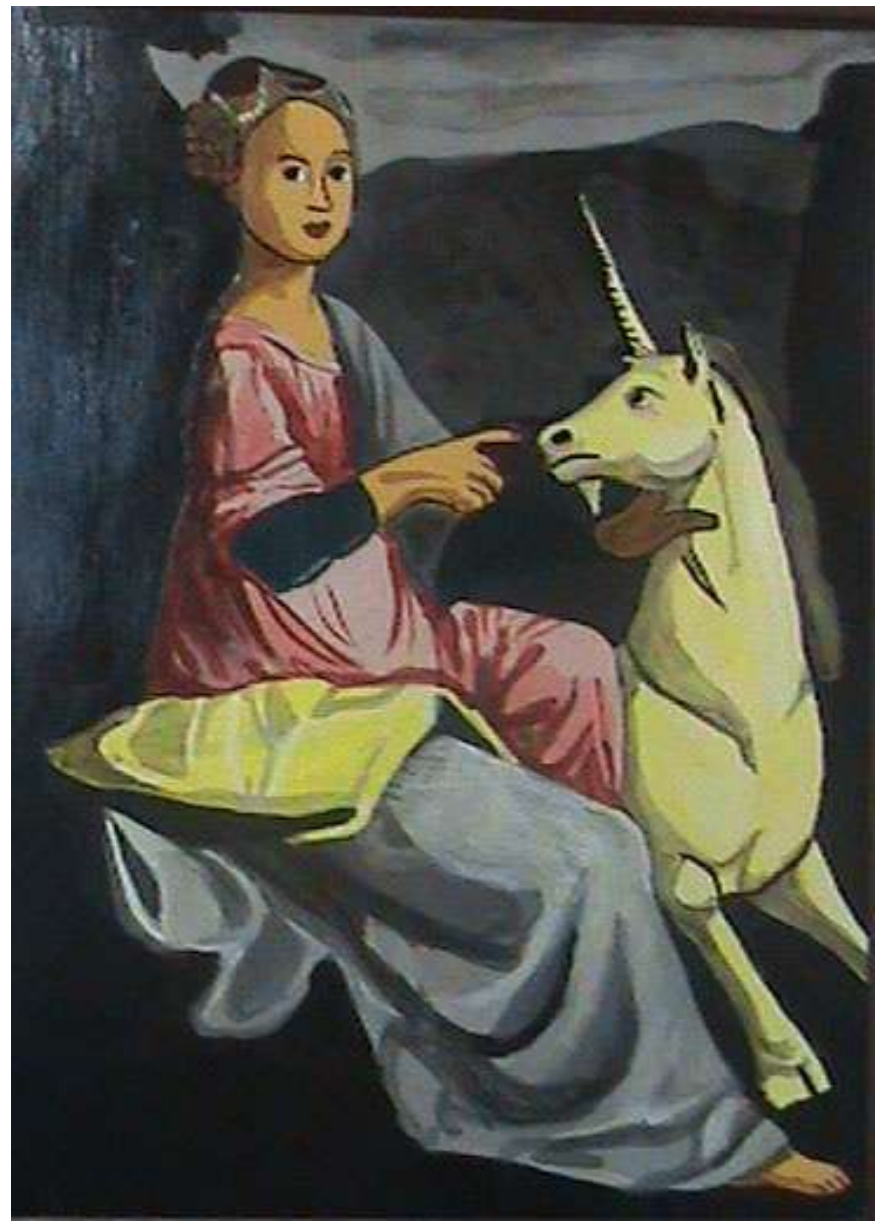
Dama con unicornio. B. Longhi Autores: Alejandro Diaz y Alejandro Bueno (4ºESO)