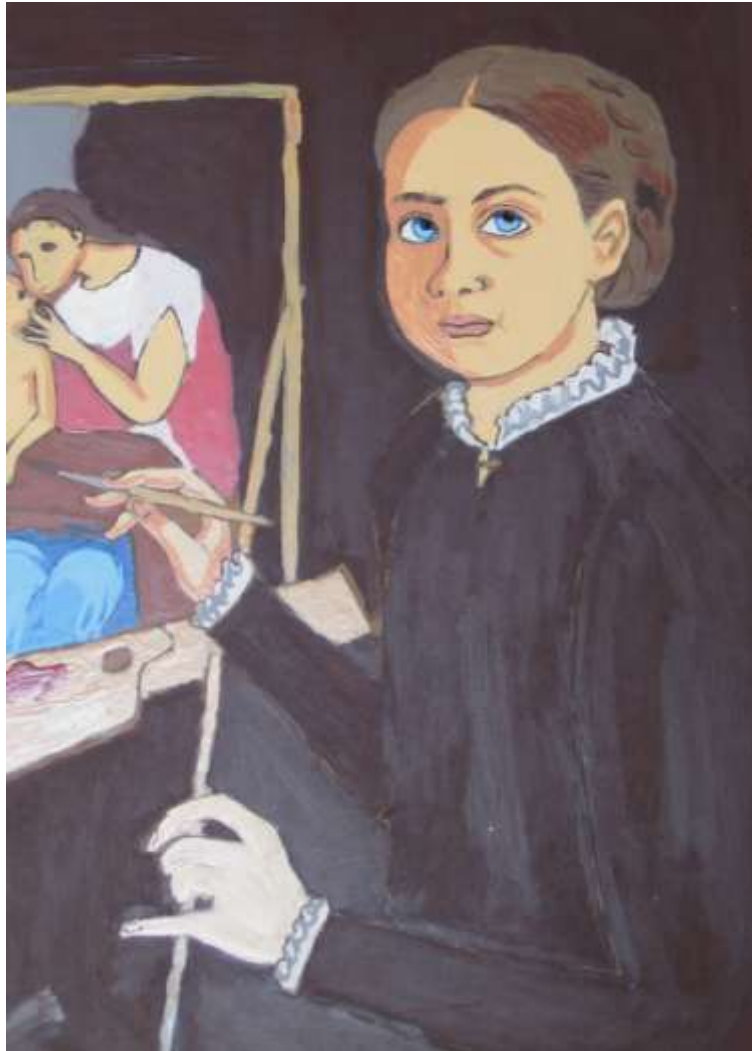
Autorretrato Sofonisba Anguissola