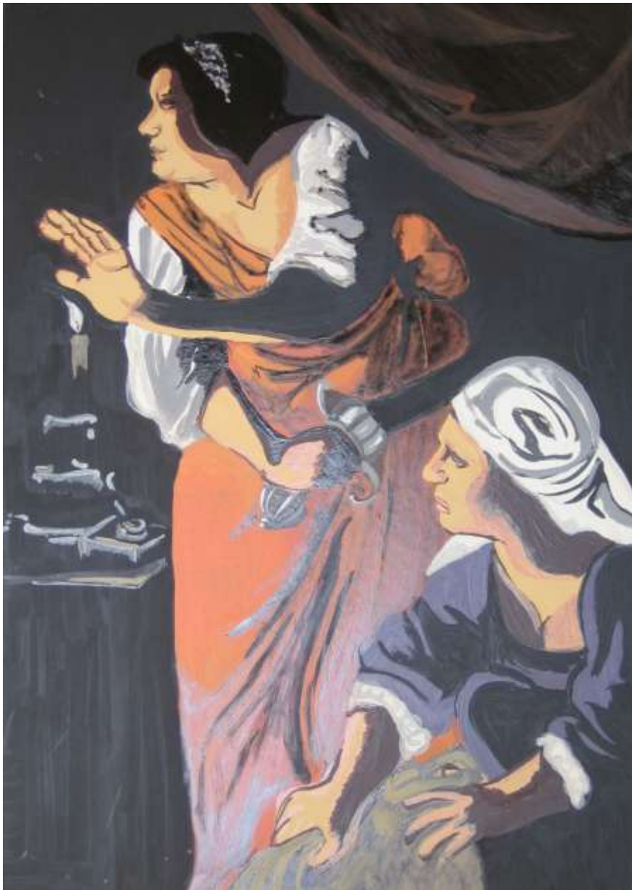
Judith y su sirvienta con la cabeza de Holofermes. A.G. Autores: Marta Ramírez y Sergio Marfil (4ºESO)