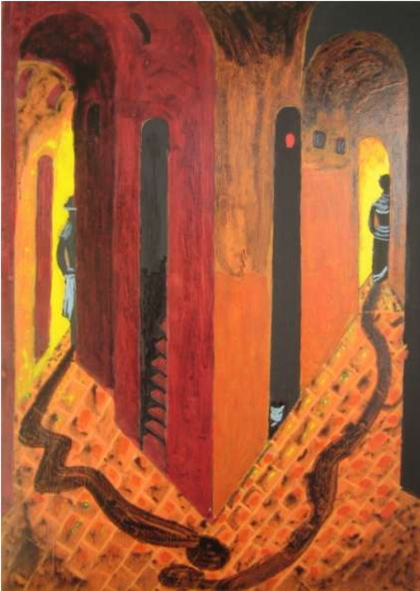
La despedida. Remedios Varo Autores: Jon Cuevas e Ignacio Vázquez (4ºESO)