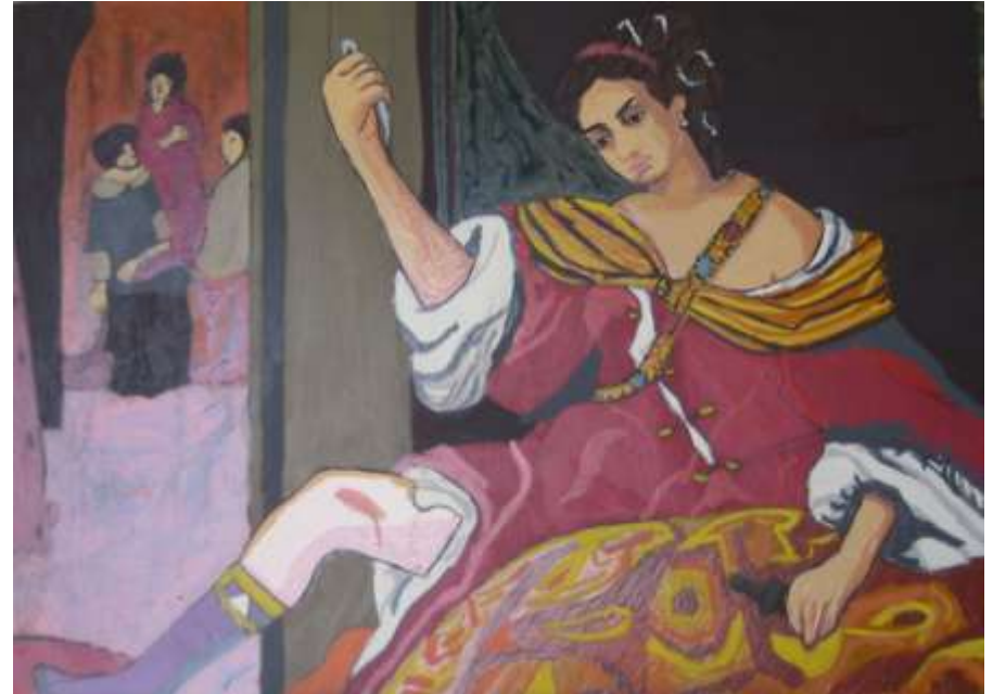
Portia hiriéndose. Elisabetta Sirani