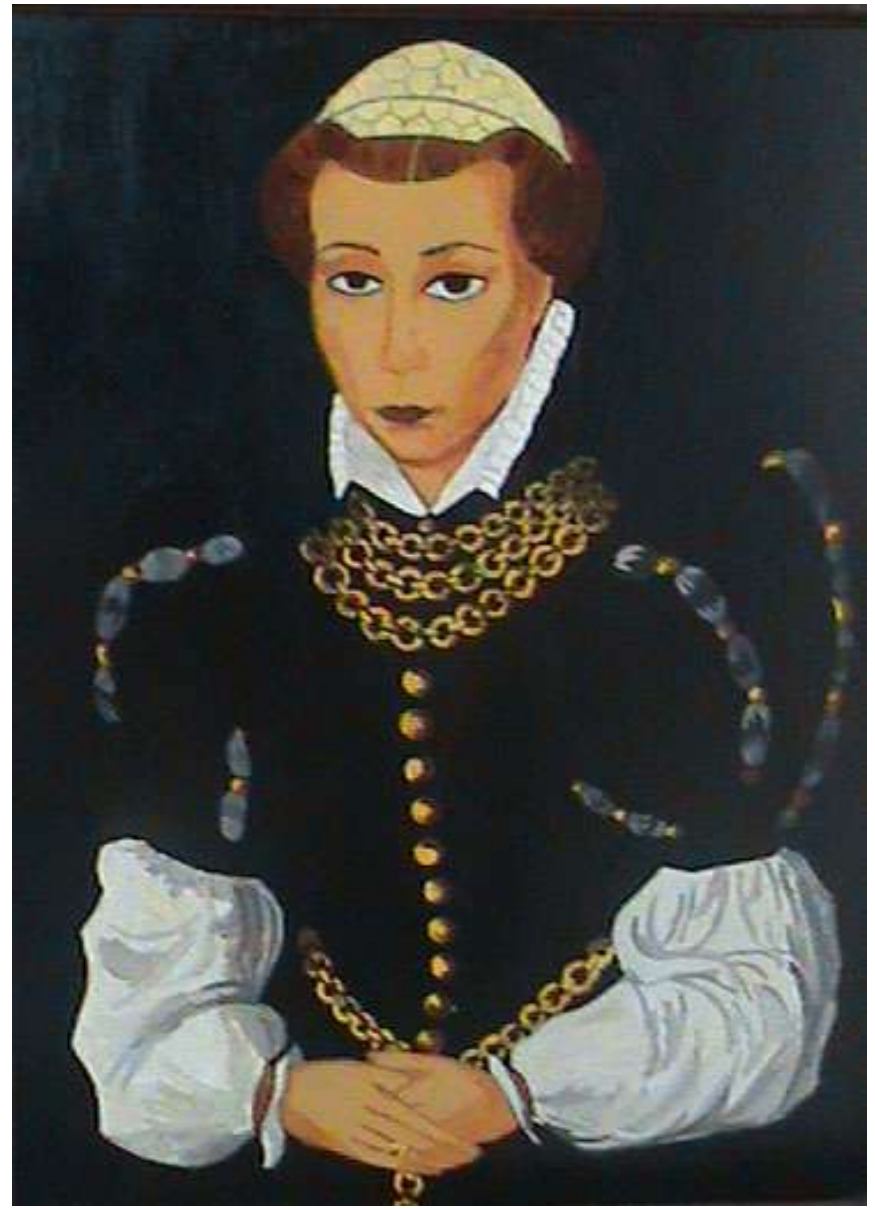
Retrato de dama. C. van Hemessen Autores: Marina Jiménez y Miguel Díaz (4ºESO)