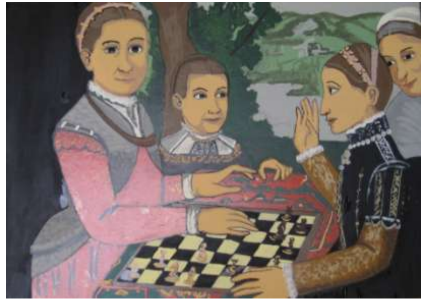
El juego de ajedrez. S. Anguissola

Autores: Jennifer Alférez y M. Carmen Baena (4ºESO)