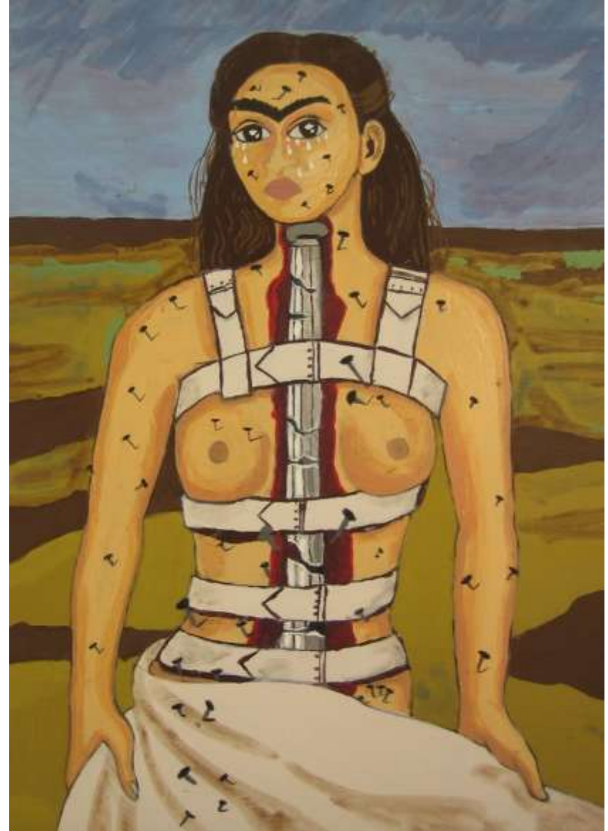
Columna rota. Frida Kahlo