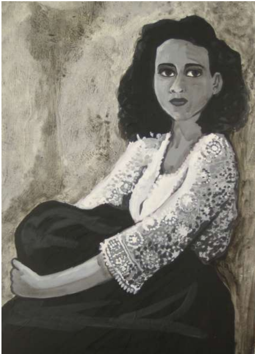
Retrato. Leonora Carrington