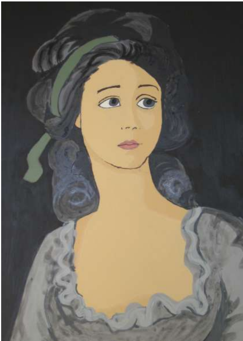
Sophie Potocka. Le Brun