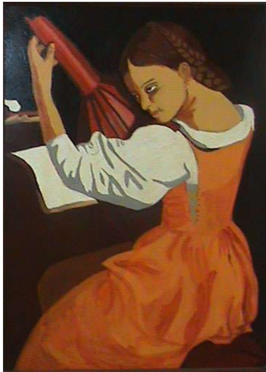
Tañidora de laúd. Tintoretto Autores: Natalia Roman y Laura Vega (4ºESO)