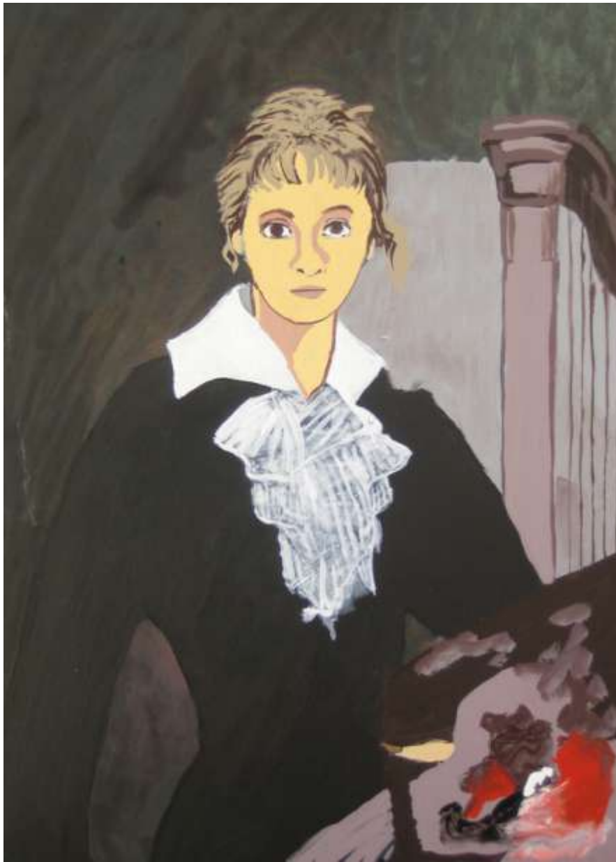
Retrato. Maria Bashkirtseva