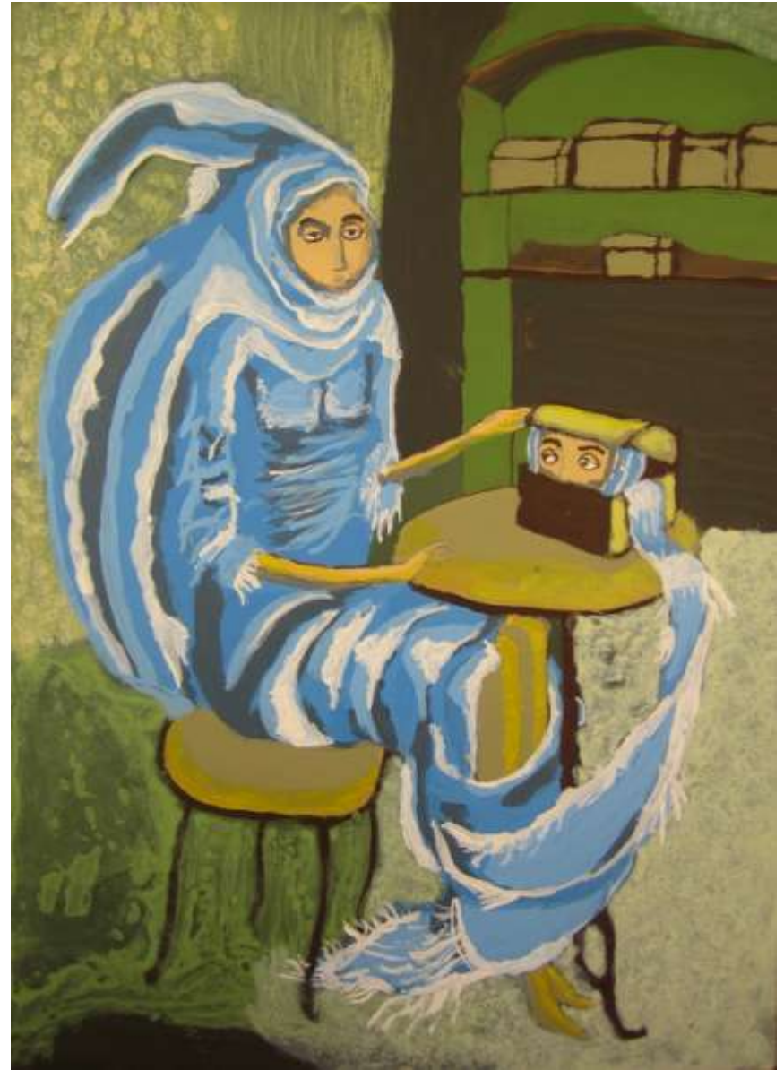
El reencuentro. Remedios Varo Autores: Franco Alderete y Francisco Hernández (4ºESO)