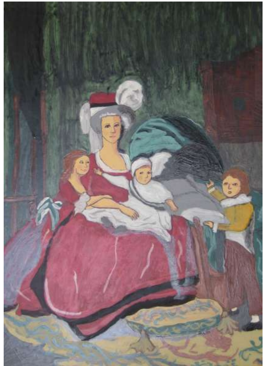
La reina Maria Antonieta y sus hijos. Le Brun