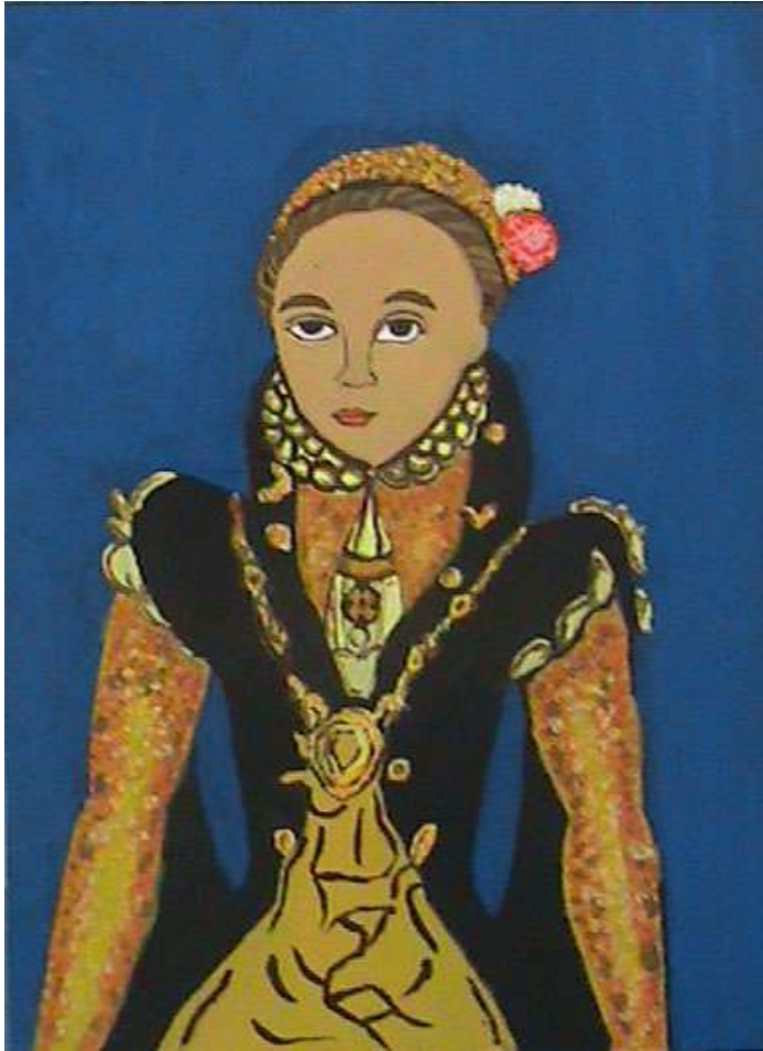
Retrato de la reina Isabel I. Levina Teerlinc

Nacida en Brujas, Flandes. Pintora miniaturista de quien existe bastante documentación. Acudió a la invitación del rey Enrique VIII para trabajar en la corte contratada como pintora de la realeza. Levina desempeñó esta labor hasta la muerte del monarca y continuó durante los tres reinados siguientes, el de Eduardo VI, el de María I y el de Isabel I, lo que da claros indicios de la gran apreciación que tenía su trabajo.