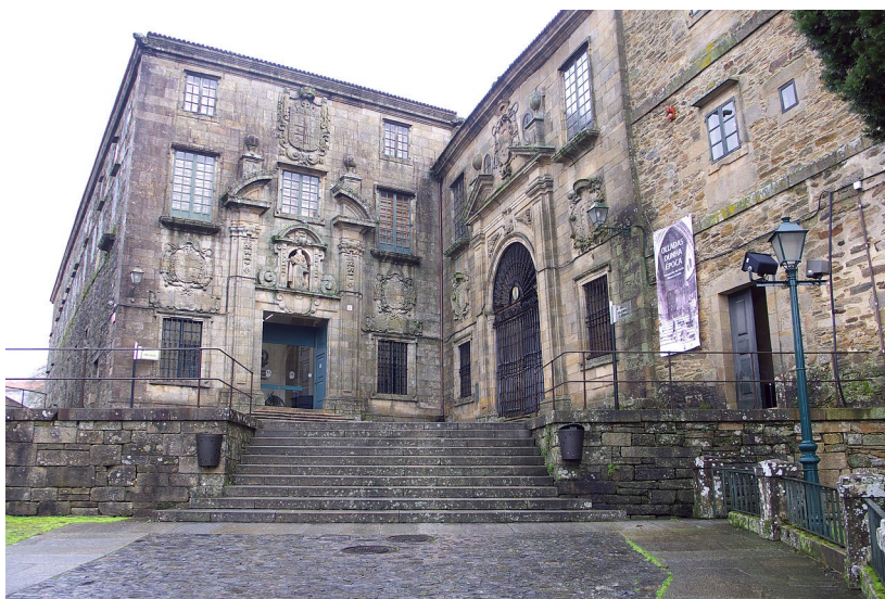
José Luis Filpo Cabana -Entrada ao convento e á igrexa de Santos Domingos de Bonaval