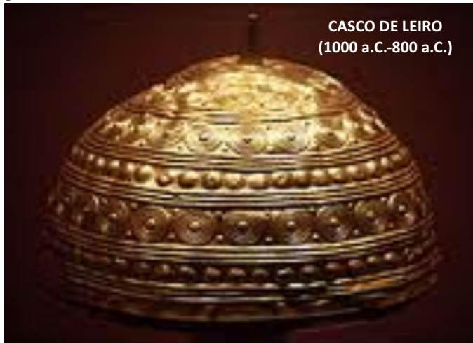
CASCO DE LEIRO (1000 a.C.-800 a.C.)