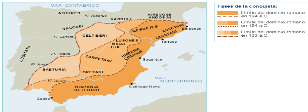
Fases de la conquista romana