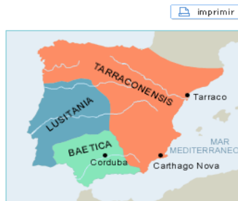
Provincias romanas en tiempos de Augusto (27 a.C. - 14 d.C.)