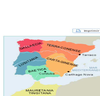
Provincias romanas tras las reformas de Diocleciano

AS CIDADES eran dirixidas polos duumviros, edís e cuestores. Fundáronse NOVAS CIDADES onde se construíron os edificios típicos romanos: teatros (Emérita), anfiteatros (Itálica), circos (Sagunto), termas (Tarraco), templos