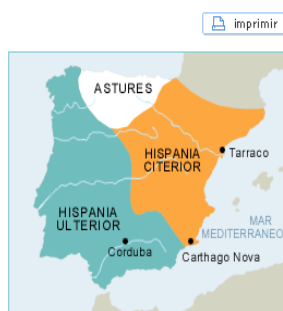
Provincias romanas en 56 a.C.

DIVISIÓN TERRITORIAL. Hispania foi dividida nun principio en dúas provincias (Citerior e Ulterior), despois en tres (Tarraconense, Bética e Lusitania) e, por último, en 6 (Tarraconense, Bética, Lusitania, Gallaecia, Cartaginense e Baleárica). Á fronte de cada provincia había un gobernador.