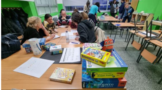
Talleres co profesorado