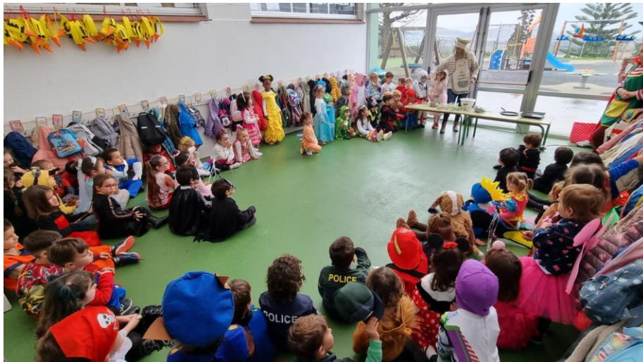
Talleres co alumnado