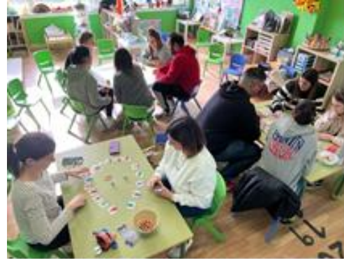
Talleres coas familias