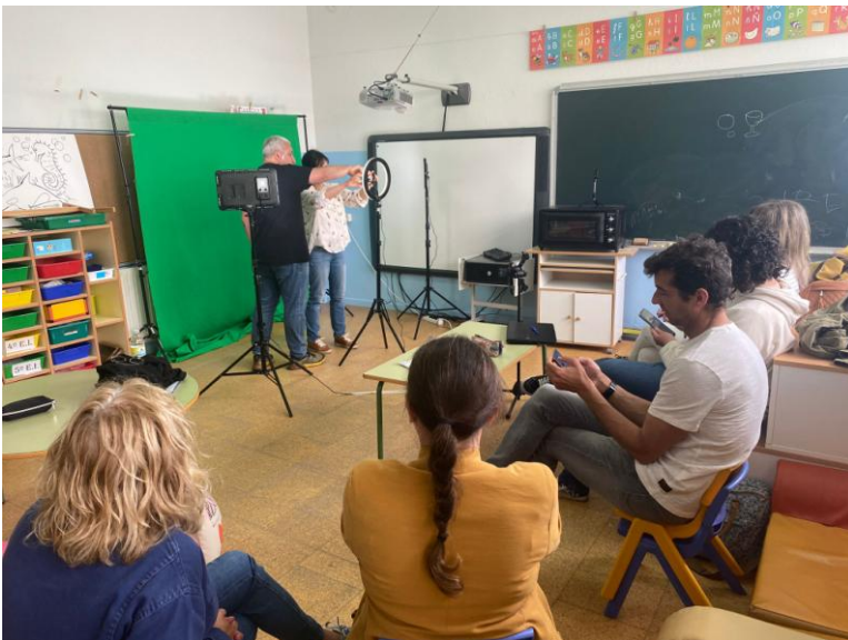
FORMACIÓN DO PROFESORADO

Permítenos enriquecer o proceso de ensino-aprendizaxe achegando un amplo abanico de posibilidades para traballar os diversos contidos, tanto en Educación Infantil, Primaria, como en Educación Secundaria Obrigatoria, dunha forma dinámica, lúdica e activa.