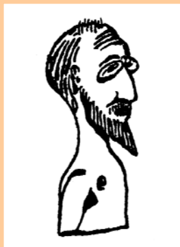
Erik Satie púxolle a música.

No ano 1924, o cineasta francés René Clair aventurouse a filmar una película (aínda muda) de acordo coas vangardas do momento: Entreacte . Esta grande obra contou cunha firmas impresionantes: Picabia escribiu o libreto nun primeiro momento para un ballet, como tamén os decorados e todo o vestuario de Marcel Duchamp , e, o estraño