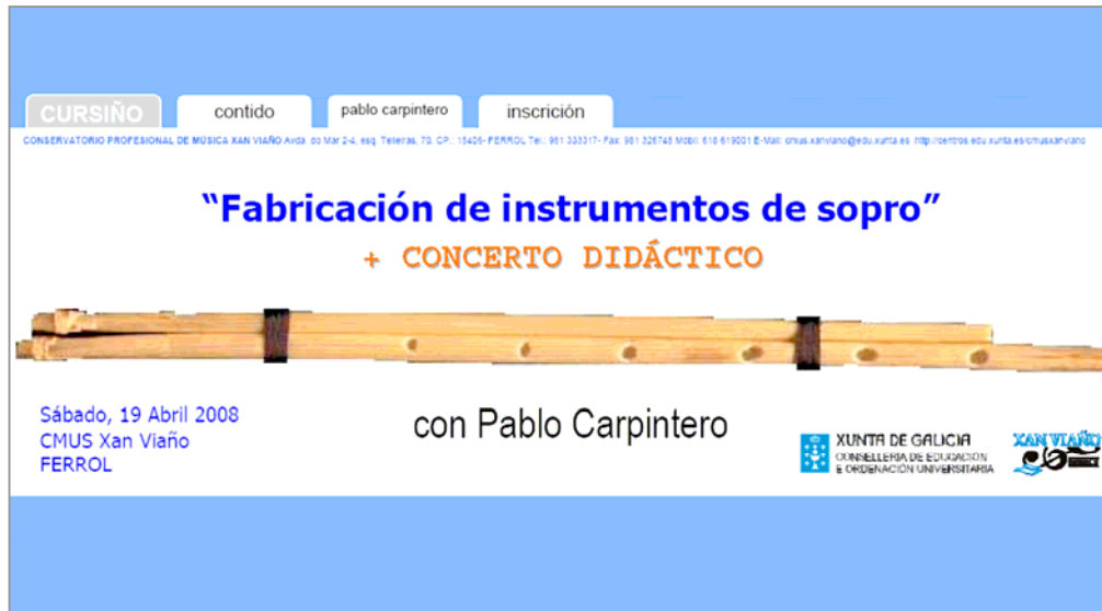
Cartel anunciador do evento

O pasado 19 de Abril tivo lugar unha xornada de música tradicional organizada polo Equipo de Normalización e Dinamización Lingüística e o Dpto. de Gaita Galega. Tivemos a ocasión de impregnarnos da manifestación máis sinxela coa que se mostra a música. Isto é: recursos populares que facían os nosos avós, cunha mestura de natureza, ocio e música. O concerto didáctico foi o peche lóxico a todo un proceso de fabricación e coñecemento de instrumentos musicais populares galegos.