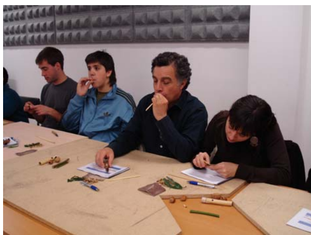
Cursillistas probando os instrumentos

Ten impartido numerosos cursos de toque pechado, fabricación de palletas, afinación de gaitas de fol antigas, toque de trompa, requinta, fabricación de instrumentos vexetais etc., sendo unha das súas principais ocupacións impartir charlas e concertos didácticos sobre os instrumentos tradicionais galegos, así como a organización de exposicións de instrumentos musicais tradicionais galegos.