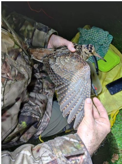
Imaxe 1. Censo de becasas e toma de datos de idades.