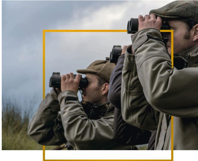
Imaxe 2. Censadores da “Fundación Artemisan”.