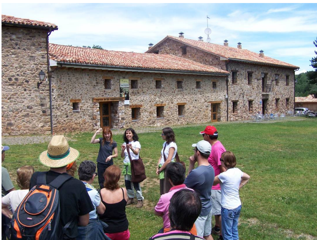
Centro de visitantes adicado á trashumancia. Parque Natural Sierra de Cebollera. La Rioja.