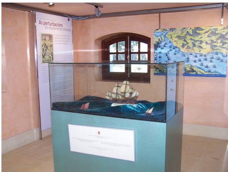
Centro de visitantes na Illa de San Simón. Redondela.

Os centros de visitantes resultan ser o primeiro lugar ao que accede o público na súa visita ao lugar con interese patrimonial, e neste senso xogan un importante papel psicolóxico no proceso de adaptación do visitante ao lugar novo, descoñecido e alonxados dos patróns urbanos que lle son familiares. Estes equipamentos aportan seguridade e permiten satisfacer moitas das necesidades do público, o cal redonda en que a experiencia sexa máis gratificante e que incremente o seu aprecio polo lugar.