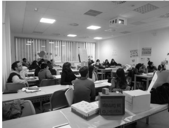
Fotografías: Superior: CEIP Altos Colegios Macarena (Sevilla). Inferior: Aula de la Facultad de Ciencias de la Educación de la Universidad de Sevilla. Alumnado de la Asignatura de Libre Configuración “Pedagogía Museística”. Universidad de Sevilla. Curso escolar: 2011/12.

Colección particular: Pablo Álvarez Domínguez.