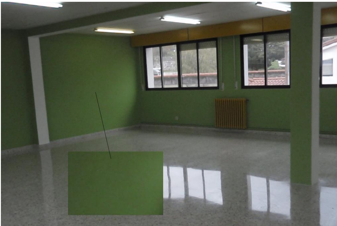
Ruído producido por escoller unha sensibilidade alta. Obras na Biblioteca '09

(Por exemplo, se estamos nun interior escuro, é dispomos de trípode, e preferible usalo, facendo unha exposición máis longa, que subir moito a sensibilidade e facer a foto a pulso.)