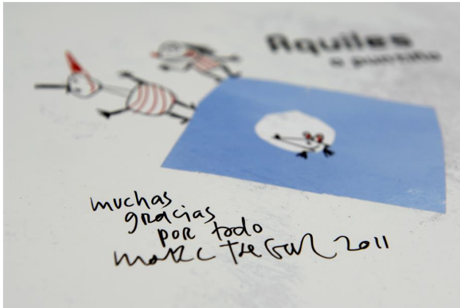
Detalle da dedicatoria do ilustrador Marc Taeger nun libro da Biblioteca. Nadal '11

PLANO DE DETALLE: amosa un obxecto enchendo por completo o encadre, recollendo unha parte significativa do elemento a fotografar.