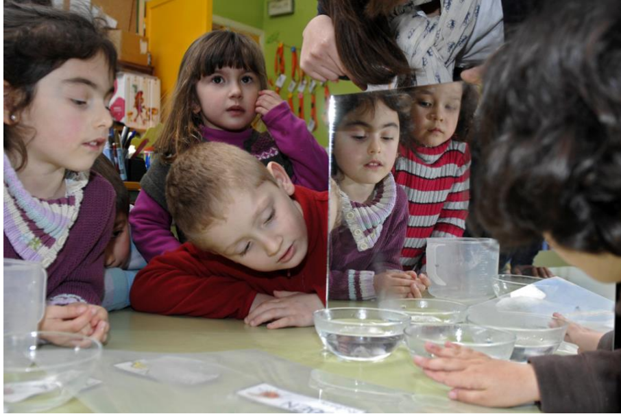
Experimentos con vapor para o Proxecto Documental Integrado "A Auga" '11

Aproveitando os reflexos tamén podemos facer que aparezan en escena personaxes que nun principio non cabían no noso encadre e aportar maior interese á imaxe.