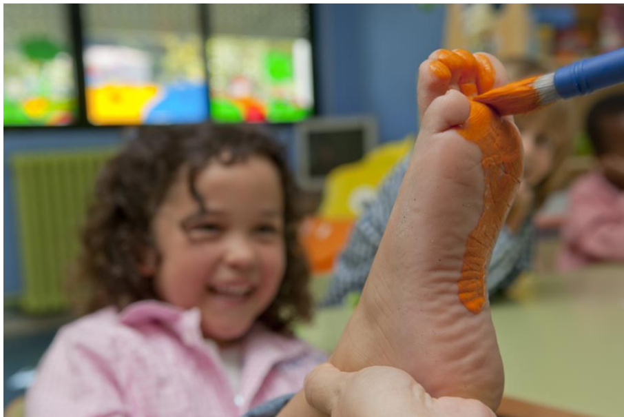
Actividade do alumnado de 6º de Ed. Infantil do CEIP "A Lama" para o coñecemento do seu corpo

Ese elemento non ten porque ser o que está no centro, nin o máis próximo, nin o que ocupa a maior parte do noso encadre, simplemente será o elemento que decidimos como de máis interese no que queremos amosar.