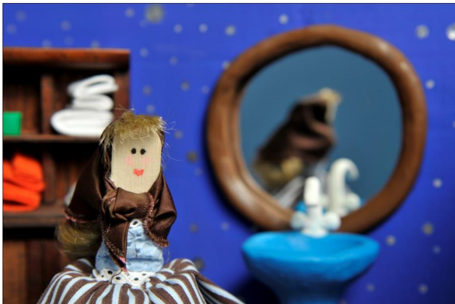
Fotograma de “A Vella Lulula”, curta de animación realizada no CEIP “A Lama” para o concurso “Nós tamén creamos” organizado pola Secretaría Xeral de Política Lingüística

O mellor xeito de aprender a facer fotos non vai ser só facelas, senón observar e analizar as imaxes de outros. É dicir, ver moita fotografía, para tentar de “educar o noso ollo” e interiorizar as regras básicas de composición que farán que as nosas imaxes sexan máis atractivas, que capten mellor a atención, que amosen coa maior calidade, creatividade e orixinalidade posible as experiencias educativas que acontecen nas nosas escolas.