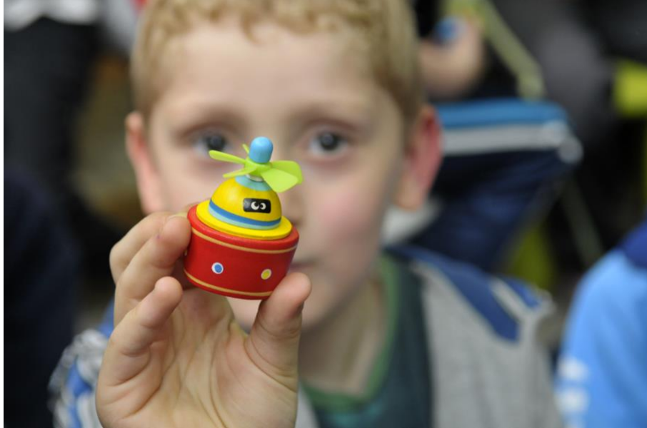
Agasallo por participar cunha creación literaria no Día do Libro '12

A profundidade de campo é a relación de nitidez que hai entre o que está no plano do enfoque e o que temos máis preto ou máis lonxe deste centro de interese.