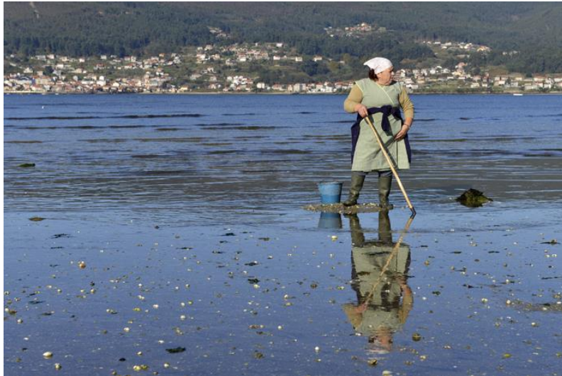
Coñecendo o traballo das mariscadores. PDI: "Ríos e praias e boas mans", CEIP "A Lama" 2013

Derivada da regra dos terzos temos a Regra do Horizonte . Independentemente de que traballemos con paisaxes, interpretaremos esta regra situando as posibles liñas horizontais da imaxe nunha das liñas horizontais imaxinarias, facendo que o que queremos destacar ocupe aproximadamente 2/3 da composición e 1/3 para a parte restante.