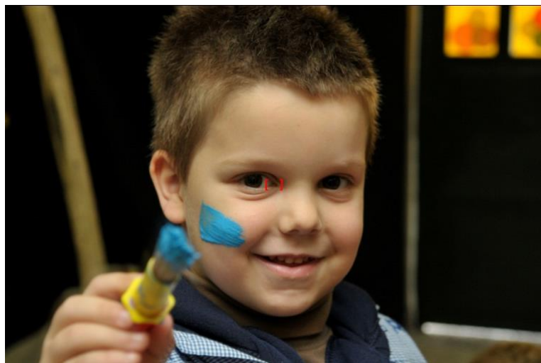
Actividade Ibarrola na Escola. PDI “Os Bosques” ‘12

Unha vez conseguida a nitidez sostemos o disparador nesa posición. É dicir, bloqueamos o enfoque.