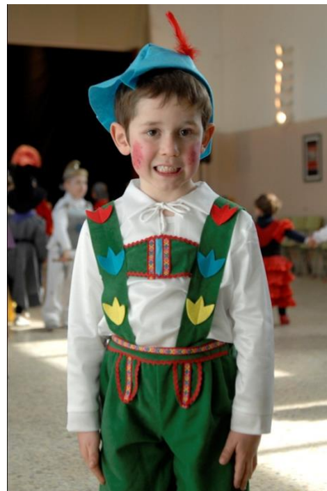
Tarde de Entroido no CEIP “A Lama” ‘11

“Un xeito de educar o ollo é comezar a analizar as imaxes das películas, da televisión, da publicidade... e tentar clasificalas en función destes planos e observando se se aplican ou non as regras que axudan na composición.”