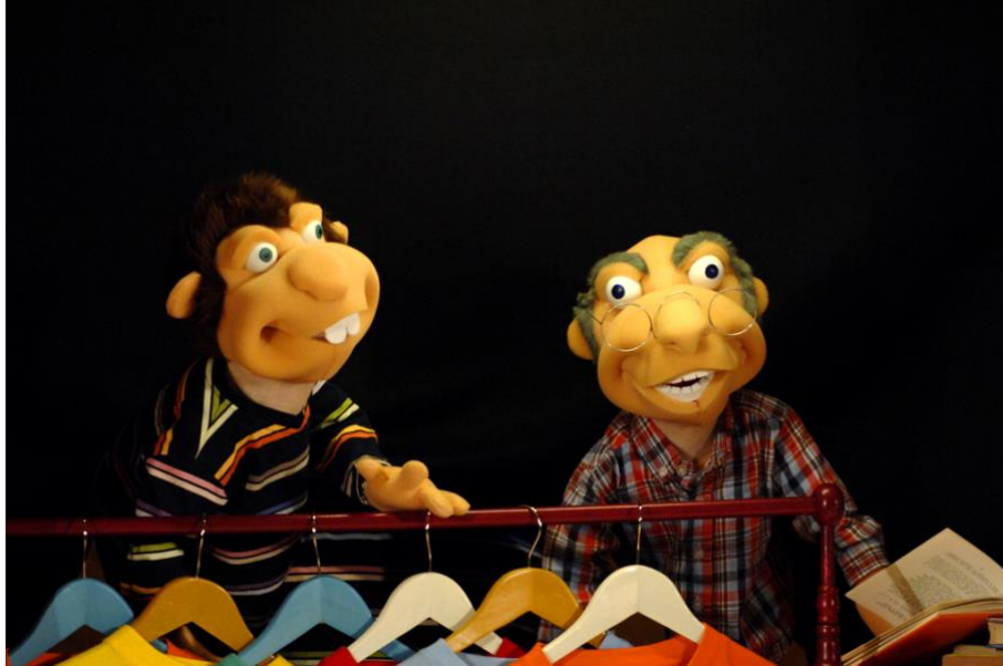
“A rebelión do monicreque”, teatro infantil da compañía Matapiollos. Setembro ‘09

PLANO MEDIO: personaxes cortadas pola cintura.