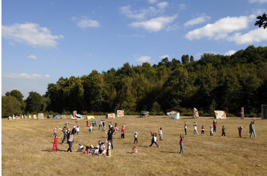
Saída cos alumnos de infantil e 1º ciclo á granxa “O Rexo” en Allariz. PDI “Os bosques” ‘12

PLANO XERAL : amosa unha gran paisaxe ou un gran decorado.