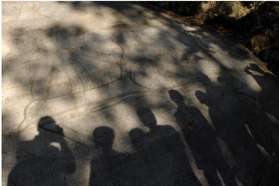
Grupo de alumnos do CEIP "A Lama" visitando o Centro de Interpretación da Arte Rupestre de Campo Lameiro (Pontevedra)

Nesta imaxe podemos observar como empregando a sombra como recurso, podemos facer que os alumnos que obviamente non se podían situar na laxe dos petróglifos, aparezan na nosa imaxe.