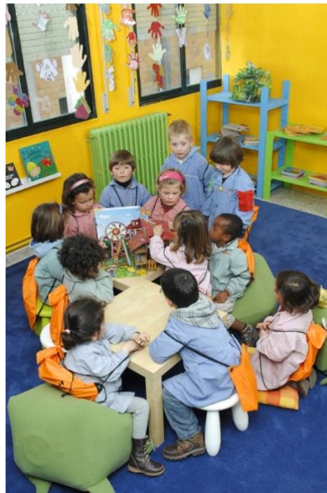
Primeiro empréstimo na Biblioteca para o alumnado de Ed. Infantil. Marzo '10

O plano de conxunto pode ser o recurso alternativo idóneo.”