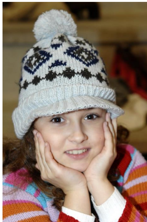
Retrato dunha alumna durante os xogos de Nadal ‘09

“Unha tipoloxía variada de planos fará que os nosos vídeos, as nosas revistas, as nosas bitácoras..., perdan a tan habitual monotonía e concentren a atención dos nosos observadores.”