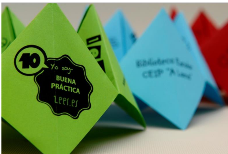
Xogo de papel elaborado polo Equipo de Biblioteca coas recomendacións lectoras para o Nadal '12

Se empregamos a maior parte da nosa fotografía con aquilo que queremos que centre o interese, estamos asegurándonos conseguir este obxectivo. Un erro moi común consiste en querer sacar demasiadas cousas. A sinxeleza axudará a que a nosa imaxe funcione e fixe a atención do observador.