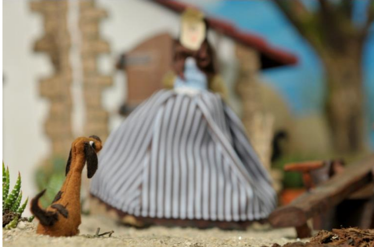
Fotogramas de “A Vella Lulula” ‘12

Na curta, neste momento está falando o can, por iso é a personaxe enfocada.