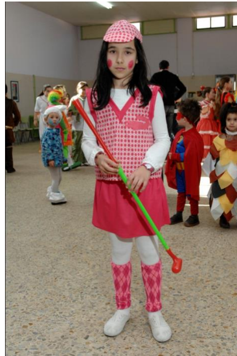
Tarde de Entroido no CEIP “A Lama” ‘12

En outras ocasións ese será o efecto desexado.”