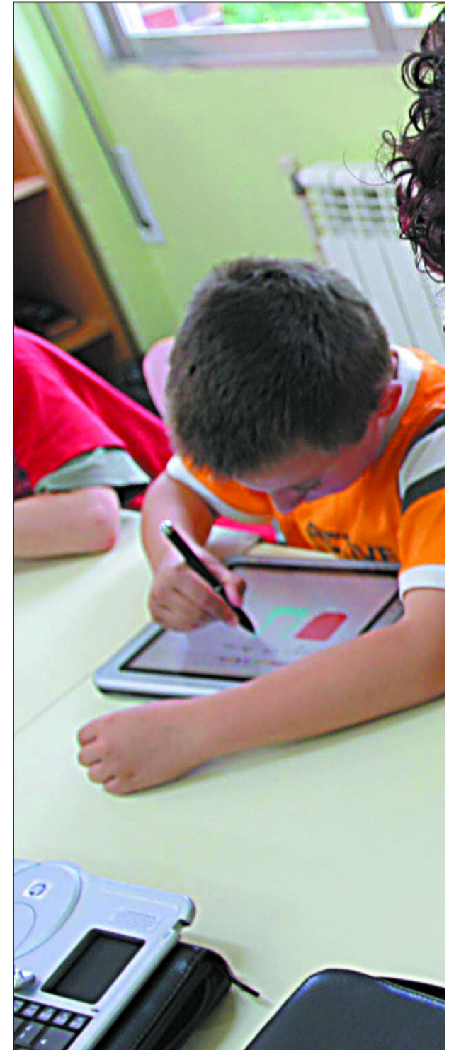
Internet abre la oportunidad de explotar el potencial creativo de los alumnos.

Los especialistas, sin embargo, insisten en advertir de que, evidentemente, un mayor uso