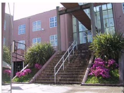
IES NEIRA VILAS