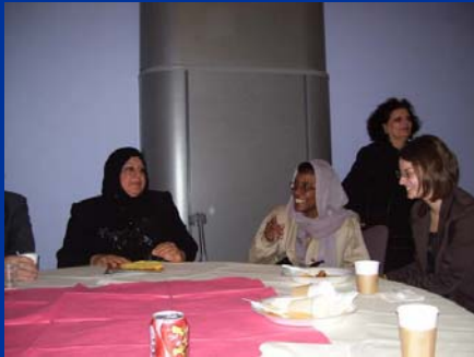
Visit Brent Refugee Forum 10th anniversary celebration