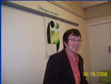
Meeting RIJ board member