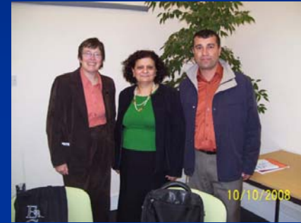
Feedback with RIJ director