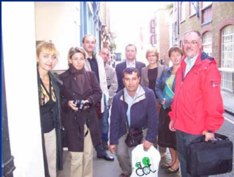
Visit London Development Agency