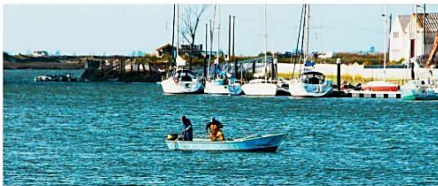
Os pescadores chegaron ao mediodía. Traían moreas de peixe.

1 Le as oracións que hai debaixo da fotografía e fíxate nas palabras destacadas. Son verbos: