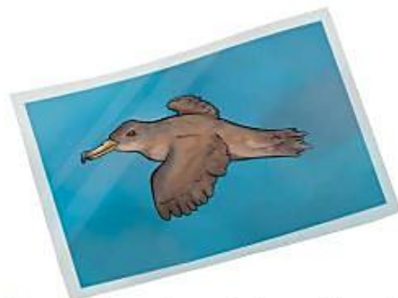
As pardelas foron fotografadas por Manuel.

O significado das dúas oracións é o mesmo, pero na primeira o verbo está en voz activa, e na segunda, en voz pasiva. Usamos unha voz ou outra dependendo do que queiramos destacar.