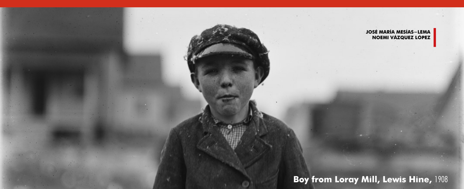
Boy from Loray Mill, Lewis Hine, 1908

insignificantes que estos pudieran parecer: “los exámenes de graduación, la función teatral de la escuela, los acontecimientos deportivos...” (Hill & Cooper, 2003, p. 10). La preocupación educativa de Hine se hizo patente en su primer artículo publicado en 1908 en The Photographic Times , acerca de la fotografía en las escuelas. El legado de Lewis Hine constituye escenografías de la educación de principios del siglo XX, siendo su interés no solo documental sino también investigador de las metodologías pedagógicas de este momento.