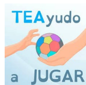
TEAyudo a jugar