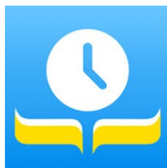
SPEED READING: ler máis rápido