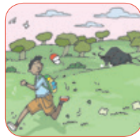
ex pon erse