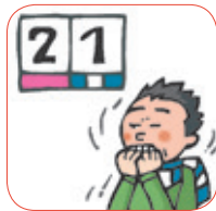
ex ci tar