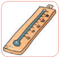
má x imo