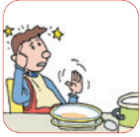
pre text o

Lee en voz alta estas palabras y cópialas después. Aprende su significado. Usa el diccionario si lo necesitas. Luego las registras en la página 72.