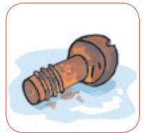
ox id ar