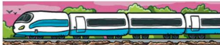
An Alfaya: O maquinista Antón, Edicións Xerais, col. Merlin.

EVA XEFE DE ESTACIÓN: Se vostede atopa o maquinista, eu tráiole o tren.