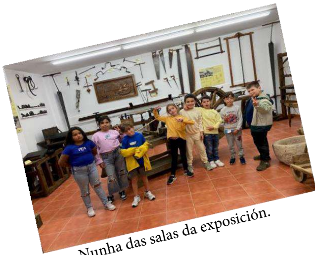
Nunha das salas da exposición.