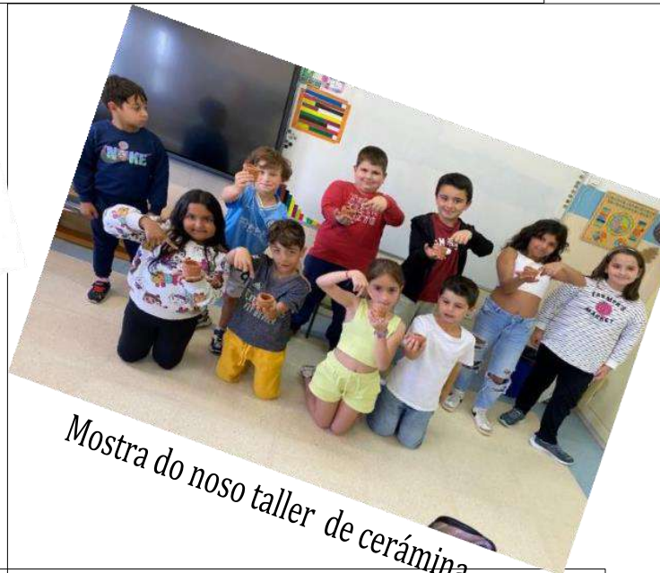
Mostra do noso taller de cerámica

Por a parte desta fixeron talleres e disfrutamos dos diferentes museos que ali hai.