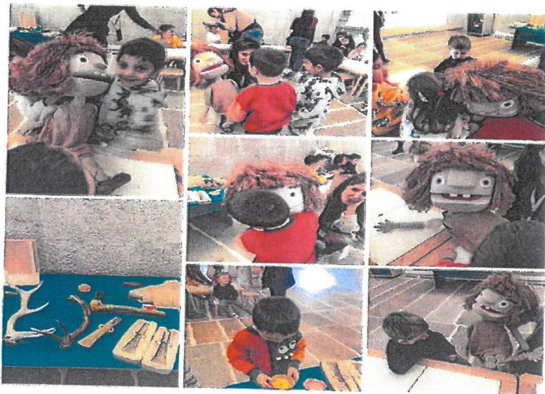
Alumnado de 5º Infantil con TREA no Museo de Pontevedra

TREA é unha boneca que viaxou no tempo para contarnos como era a vida cotiá fai miles de anos. Da súa man, coñecemos máis en detalle a vida dos homes e as mulleres da prehistoria.