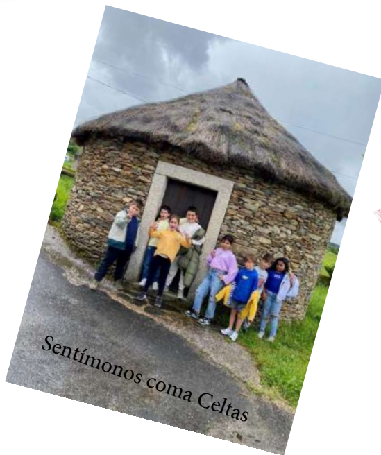
Sentímonos coma Celtas

Vimos unha vila con varias localidades das zonas que se atopan nas diferentes excursións do Castro que está neste.