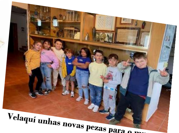
Velaquí unhas novas pezas para o museo.

Tamén vimos como era unha aula das escolas velhas.