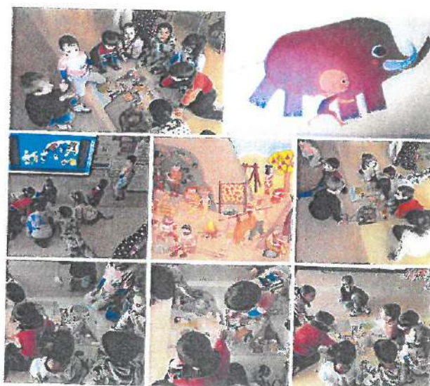
Alumnado de 5º Infantil buscando información sobre a prehistoria

Agora xa estamos list@s para ir ao Museo e gozar da visita.