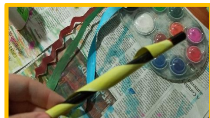
DOBRANDO COA AXUDA DUN LAPIS