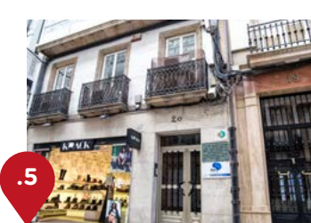
Real, 20 Real, 20 En febrero de 1895, Picasso realizó su primera exposición en el número 20, en lo que entonces era una tienda de muebles. Recibió dos críticas excelentes en la prensa tras mostrar diversos estudios de cabeza. En marzo hizo la segunda en esta misma vía, se cree que en el número 54 mostró “El hombre de la gorra”, que hoy conserva el Museo Picasso de París.