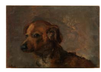
Clíper, el perro del artista por Pablo Picasso. A Coruña, 1885.