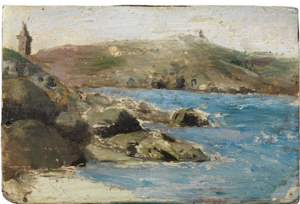
La Torre de Hércules de Picasso. A Coruña, 1895. (.8)