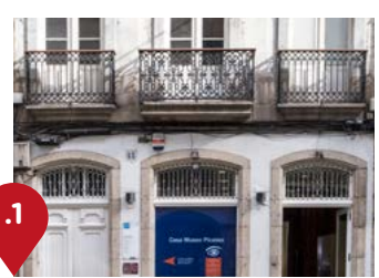
Casa-museo Picasso Payo Gómez, 14 T 981 189 854 / T 010 (llamadas locales) www.coruna.gal/cultura

En octubre de de 1891, la familia Ruiz Picasso, procedente de Málaga, se instaló en el segundo piso del número 14 de la calle Payo Gómez, en el que vivirán hasta abril de 1895. Es una casa coruñesa de arquitectura típica, con galerías de madera, y cuya estructura original se mantiene. En este piso, el Ayuntamiento de A Coruña ha recreado una vivienda del siglo XIX en la que se pueden ver reproducciones de la obra coruñesa de Picasso, así como un grabado original del artista y el mejor cuadro pintando nunca por su padre, un “Palomar” con nueve aves. Cuenta la leyenda que, como su padre estaba perdiendo vista, las patitas de las palomas las ejecutó el niño.