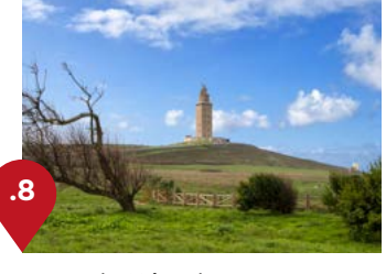
Torre de Hércules Doctor Vázquez Iglesias, s/n. Tlf: 981 223 730 torredeherculesacoruna.com