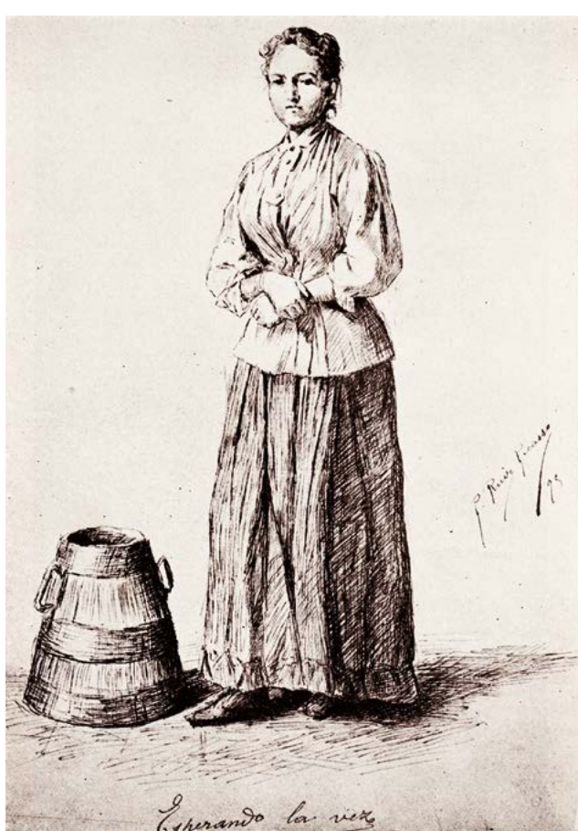
Esperando la vez de Picasso. A Coruña, 1895.