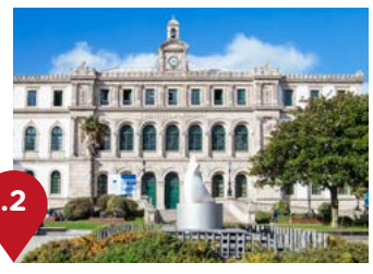
Plaza de Pontevedra El Eusebio da Guarda, hoy instituto, es el centro en el que Picasso estudió enseñanza secundaria, con malas notas, y Bellas Artes, con excelentes calificaciones. En la primera planta de este edificio recibió durante tres cursos clases de arte como su padre, Román Navarro o Isidoro Brocos. Además, aquí realizó sus primeras exposiciones colectivas. En la plaza exterior, el niño jugaba a los toros con sus compañeros, usando las chaquetas como muletas.