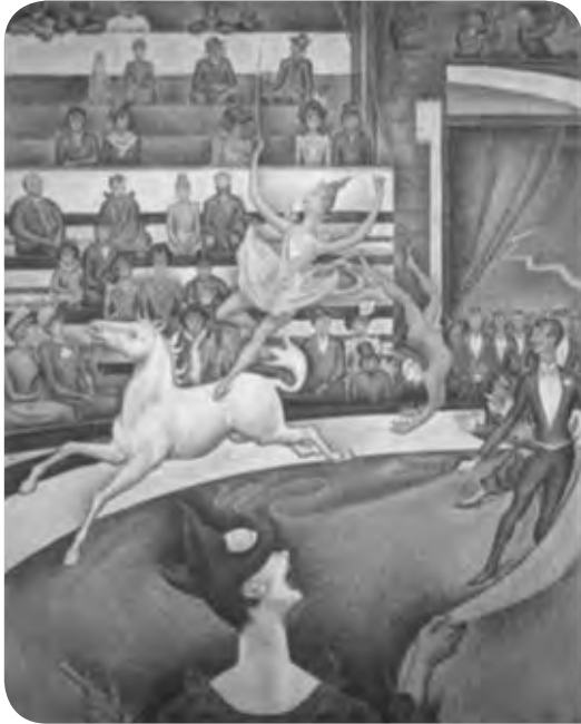
El circo (1891), Georges Pierre Seurat. Museo de Orsay, París.

1 Observa con atención y piensa las respuestas.