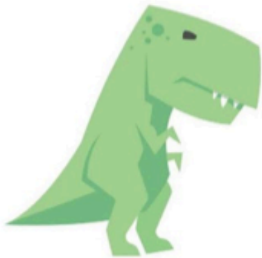
TIRANOSAURIO REX tiranosaurio rex