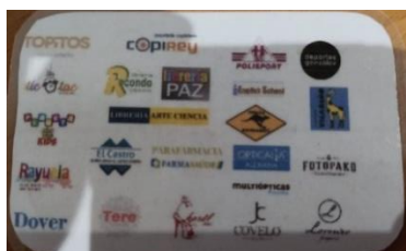
Carné para socios/as con descontos en establecementos