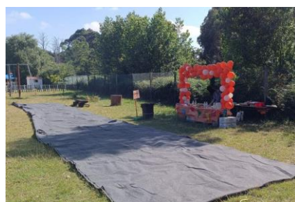
Festa Fin de curso (xunto co colexio Pena de Francia)