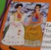
Las dos Fridas (1939) Tras su breve divorcio, Frida ambuló en este cuadro sus sentimientos amargos de entonces.