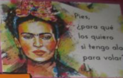
Pies, ¿para qué los quiero si tengo alas para volar?