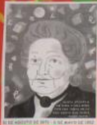
18 DE AGOSTO DE 1870 - 6 DE MAYO DE 1952

EN SUS AULAS SE JUNTAN NIÑOS Y NIÑAS DE DIFERENTES EDADES