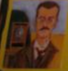
Retrato de su padre (1951) Diez años después de la muerte de su padre, Frida le retrató con un rostro joven, como le recordaba.