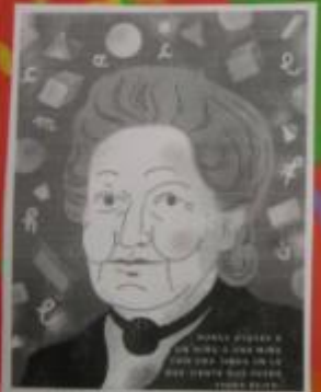
11 DE AGOSTO DE 1870 - 6 DE MAYO DE 1952

EN SUS AULAS SE JUNTAN NIÑOS Y NIÑAS DE DIFERENTES EDADES