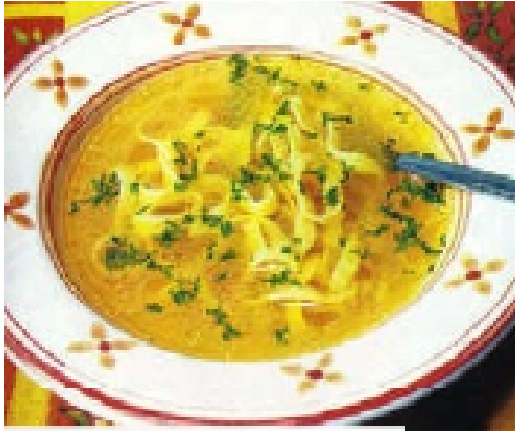
Ciorba de burta