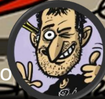
Ilustración de: Luis Davila @OBichero

XA TE ME ESTÁS MARCHANDO POR ONDE VIÑECHES!!