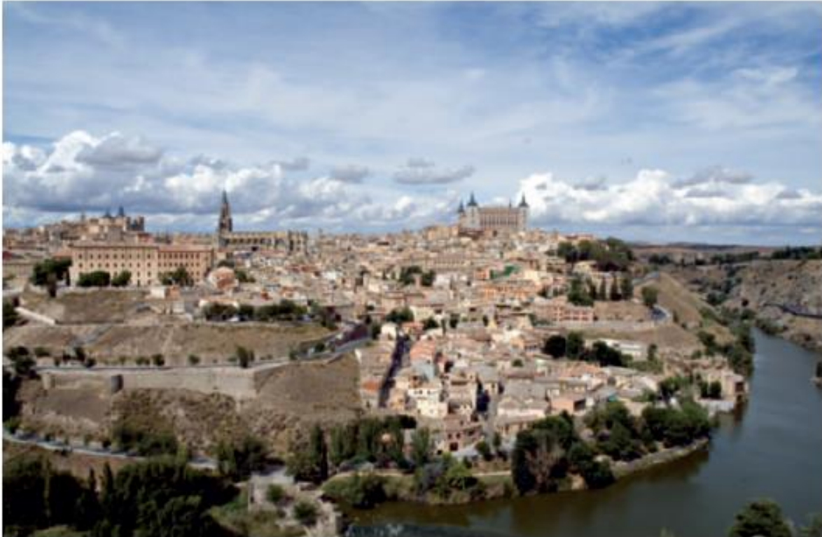
Vista de Toledo.

C orría o verán de 1081. O rei leonés Afonso VI lembraba a súa apracible estancia en Toledo anos atrás, cando fora hóspede do rei toledano Al-Mamún. Ocorreu tras ser vencido polo seu irmán Sancho e saír desterrado de Castela. Daqueles días, a pesar da amargura do desterro, gardaba, non obstante, un bo recordo.