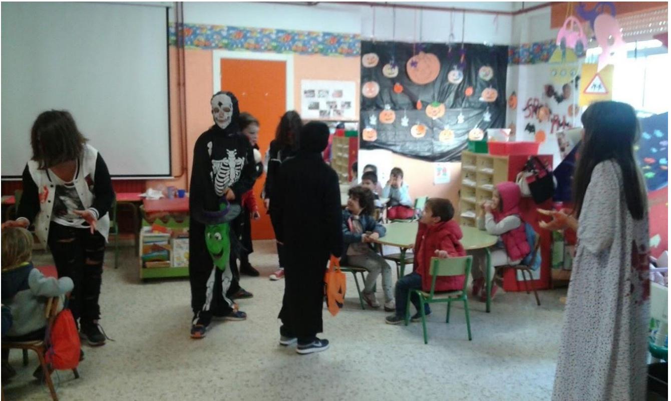
DE VISITA POLAS AULAS