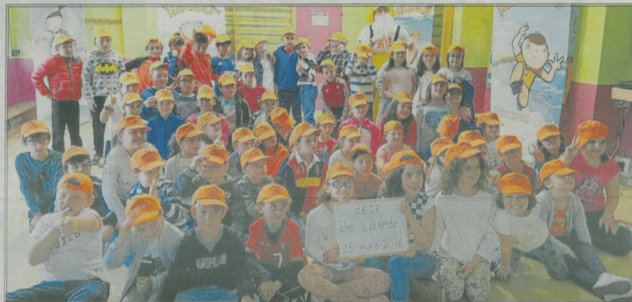
La tradición marinera está presente en la alimentación y en los proyectos educativos.