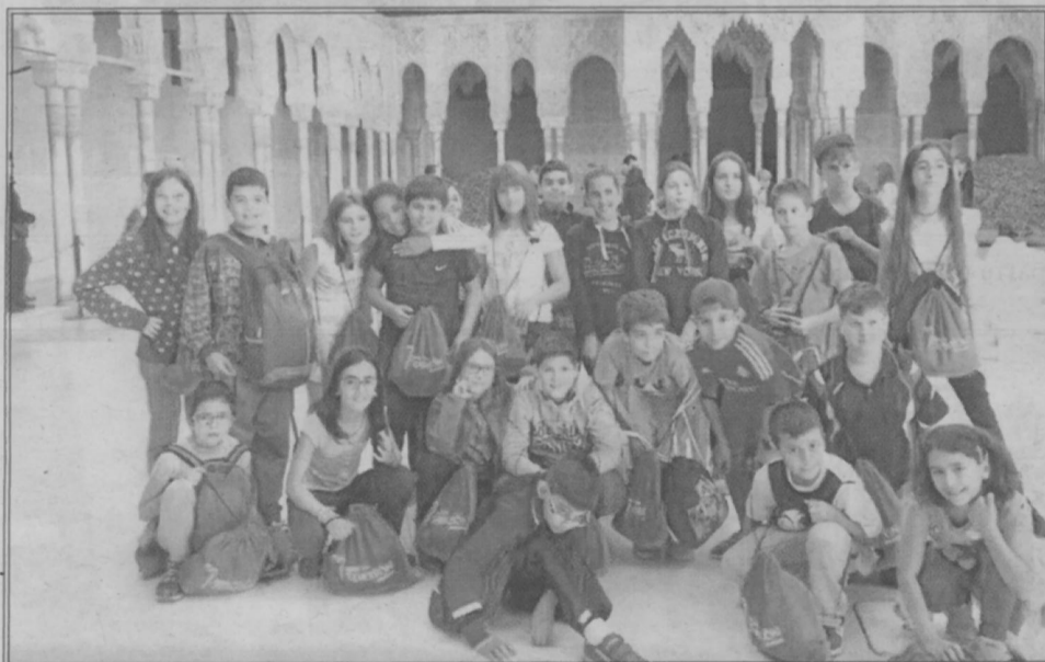
Rutas literarias para los alumnos de Educación Primaria.

rentes técnicas de animación, cromas, arduinos, la expresión y dramatización que pretenden sensibilizar sobre el cuidado del medio marino y de una necesaria cultura marítima. Especial protagonismo por su impacto social y reconocimiento, es el premio nacional por el proyecto “Esencia Laredo” concedido por la Fundación BBVA sobre el fomento del em-