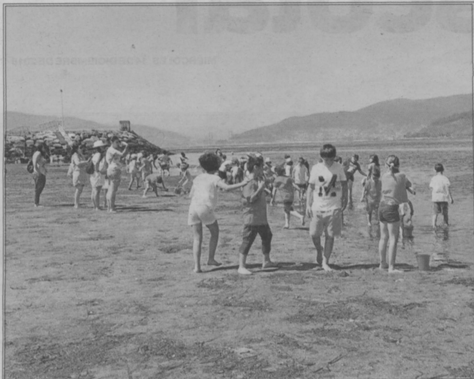
El medio natural que rodea al colegio está incluido en las actividades de los alumnos.