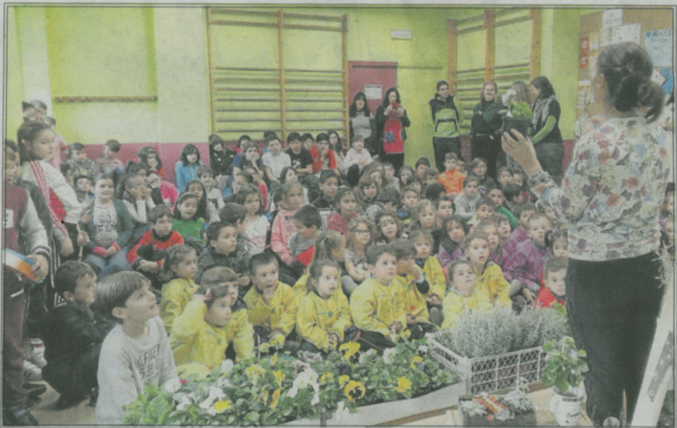
Los alumnos y profesores trabajan proyectos y experiencias.

El CEIP de Laredo cuenta con un medio directo de información sobre su día a día en www.ceipdelaredo.com así como en las redes sociales, Youtube: https://www.youtube.com/user/ceiplaredo y Twitter http://twitter.com/ceipdelaredo con más de 1200 seguidores y es un referente experiencial en la Educación Infantil y Educación Primaria en Galicia. Laredo es un centro educativo de gran calidad humana y profesional donde la innovación y la experiencias son un hecho, donde el saber ocupa un lugar.