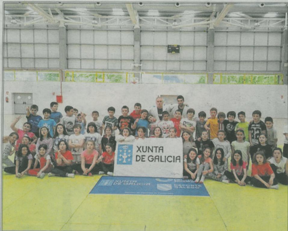
Los deportes, parte del protecto educativo del centro.