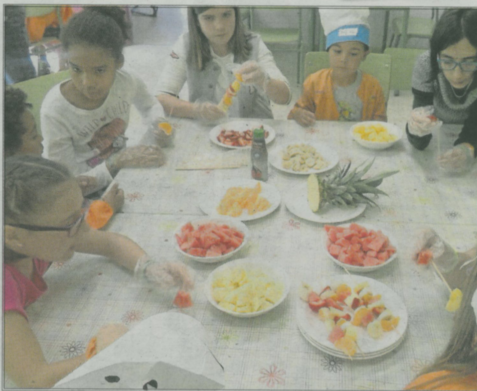
La salud es uno de los temas a tratar en el aula.