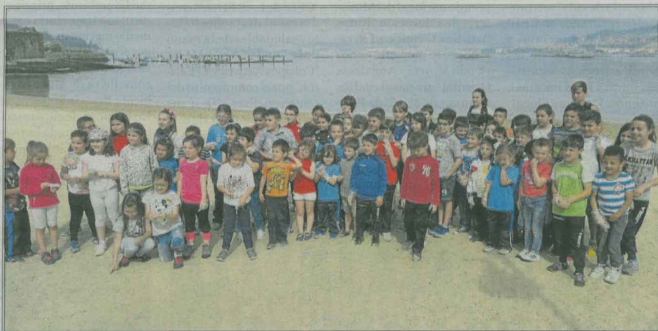
El mar y el entorno natural es parte del currículo escolar.