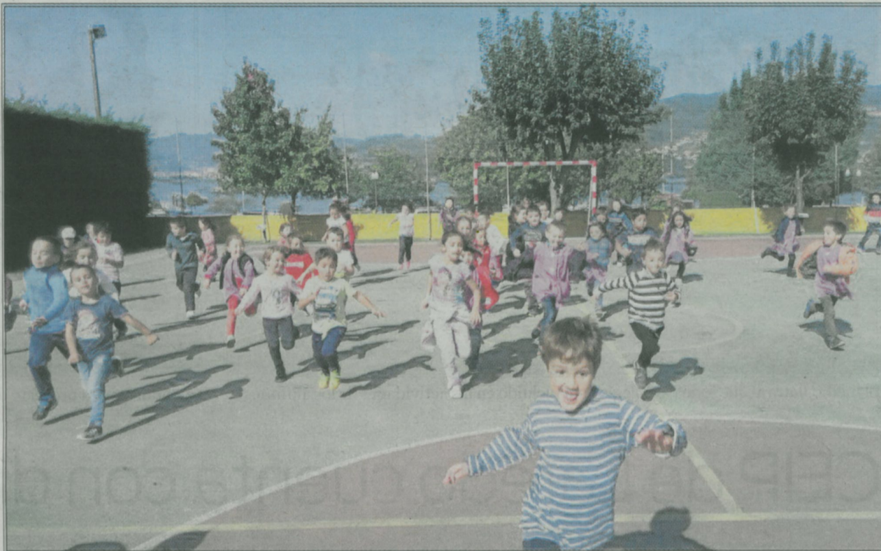
Los alumnos del CEIP de Laredo forman una gran familia.

toría, de audición/lenguaje y de pedagogía terapéutica corren a cargo de profesionales del sector educativo para atender a las necesidades del alumnado y las dudas, orientaciones, pautas y guías para las familias. El consejo escolar, el ANPA y entidades varias son las encargadas de representar al sector de las familias en el centro así como conciliar en todo lo posible la vida laboral-familiar prestando servicios de comedor, actividades extraescolares gratuitas, reuniones y fiestas de convivencia. Existe también un compromiso con las tecnologías de la información y comunicación. La tradición, la cultura y la historia conviven con las nuevas tecnologías en un centro donde no existe aula de informática. Las tecnologías de la información y comunicación están en las aulas para el uso diario de todas las materias y no están circunscritas a una excepcionalidad: tablets, ordenadores, portátiles, proyectores y pizarras digitales interactivas, gafas de realidad virtual se dinamizan en las propias clases y se flexibilizan con un aula móvil. El centro también apuesta por un compromiso con el medio ambiente. Salud, medio ambiente, el mar, la montaña y la naturaleza son conceptos muy arraigados y con tradición en los proyectos anuales del centro.