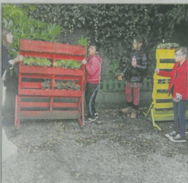
"Esencia de Laredo", todo un trabajo en equipo.