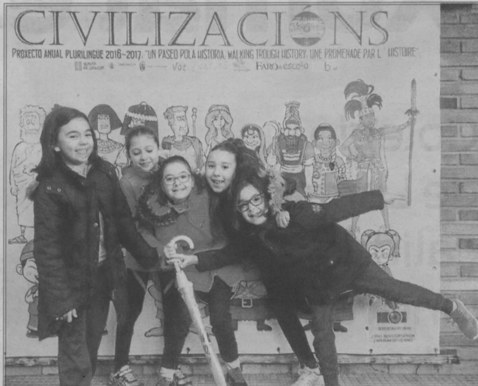
Cuentan con un proyecto de estudio de las antiguas civilizaciones.