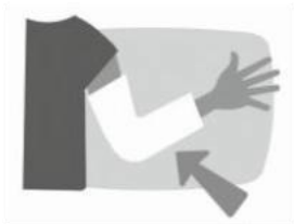
esca a io las

2 Escribe o plural dos nomes destes debuxos. Logo rodea o // de vermello e o i de azul.