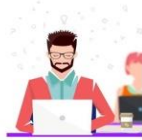
Netiqueta: buenas prácticas

Veamos algunas de las pautas que forman la Netiqueta y que las debemos entender como buenas prácticas genéricas en el ámbito digital.