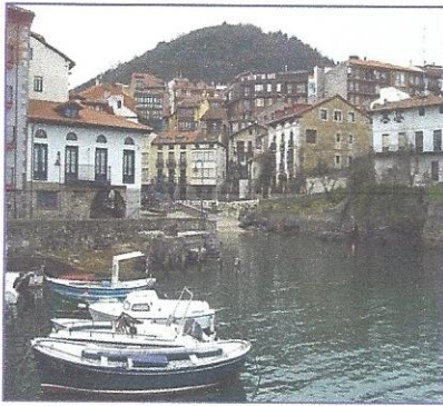
aldea de montaña

Está preto do mar e moitos dos seus habitantes traballan na pesca ou no turismo.