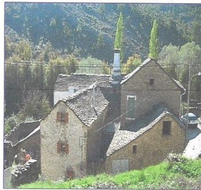
aldea de chaira

Está preto do mar e moitos dos seus habitantes traballan na pesca ou no turismo.