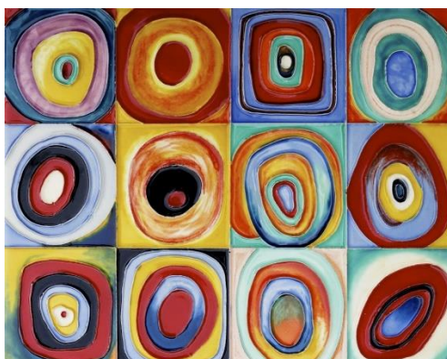
Estudio de cor. Cadrados con círculos concéntricos, Wassily Kandinsky.

Esta semana propoñémosvos unha actividade de arte. Partimos da seguinte obra: