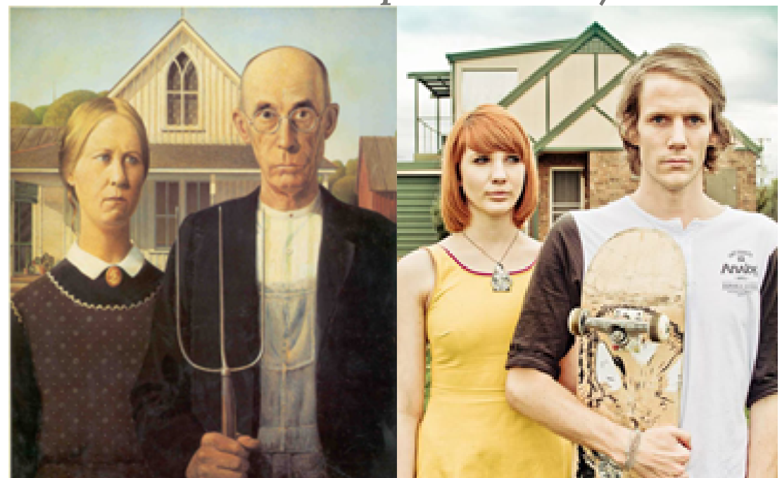
"AMERICAN GOTHIC" DE GRANT WOOD