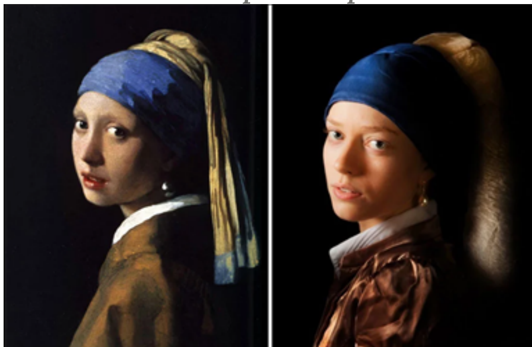
"LA JOVEN DE LA PERLA" DE VERMEER - FOTOGRAFÍA DE YULIA LYASHENKO

Faremos unha montaxe con todas as fotografías recibidas e compartirémola na páxina do cole para que adiviñedes as dos vosos compañeiros/as.