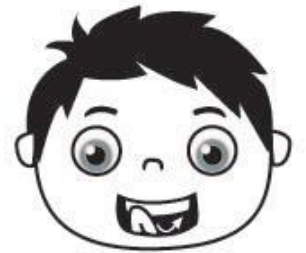
Limpia las cortinas (recorre los dientes por fuera y por dentro)