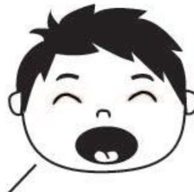
Se abre la puerta (abro la boca)