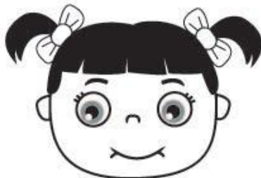
m m m m m