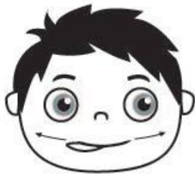
Mira a los lados (lateralización de la lengua)

- Praxias: realiza movementos coa tua cara e a lingua. Podes seguir os debuxos ou mirar estes exercicios cos minions: https://www.youtube.com/watch?v=ngOZaYcMpQ0