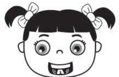
r r r r r r r r