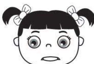
f f f f f f f