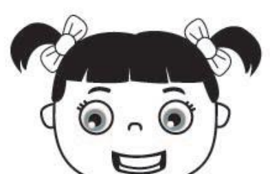
ch ch ch