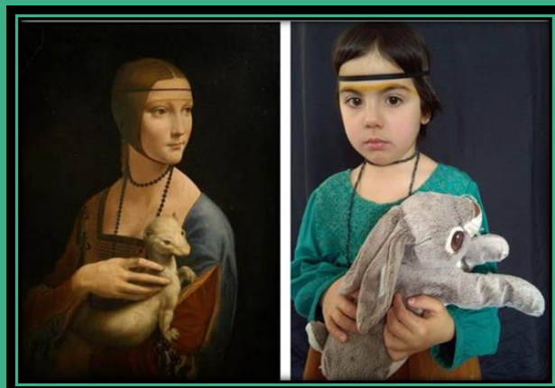
A dama do armiño. Leonardo Da Vinci.