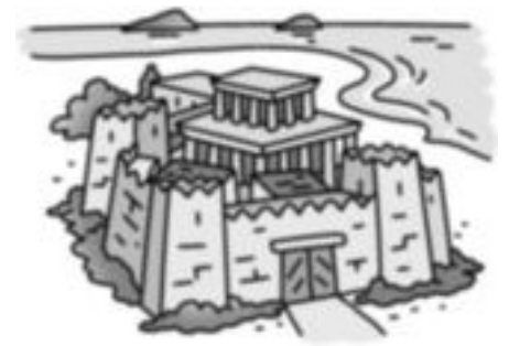
A cidade atacada