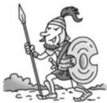
O seu capitán