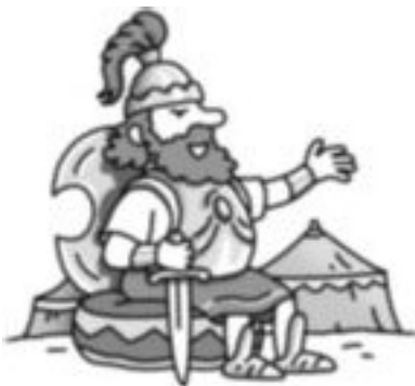
O rei dos gregos