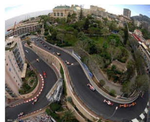
CIRCUITO DE MONTECARLO