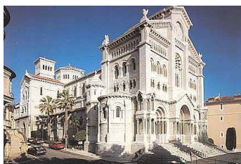
CATEDRAL SAN NICOLÁS