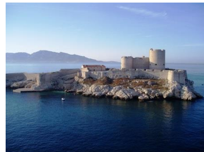
CASTILLO DE IF